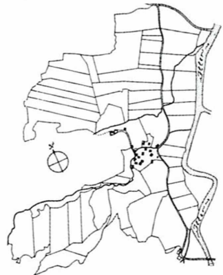
Gar nichts mehr schief und krumm. Flurbereinigung in Bihlerdorf/Allgäu vor und nach 1818