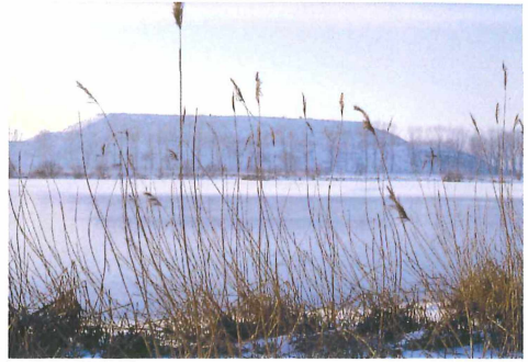
Fernblick auf die Station