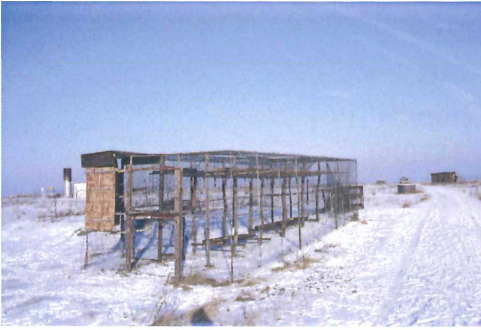
Krähenfalle auf der Mülldeponie Watenbüttel Braunschweig 1