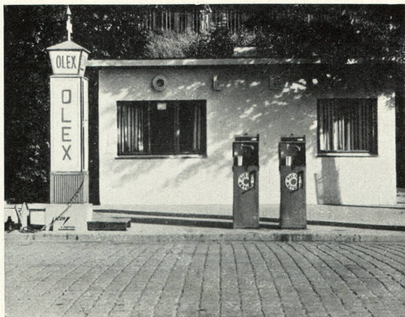
Wie es sein sollte!