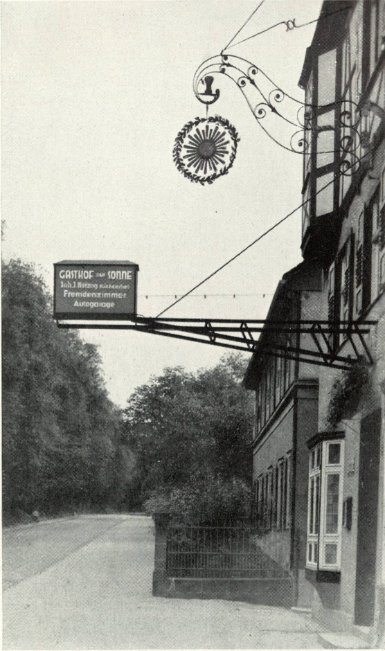
Die gute alte und die schreckliche neue Zeit.