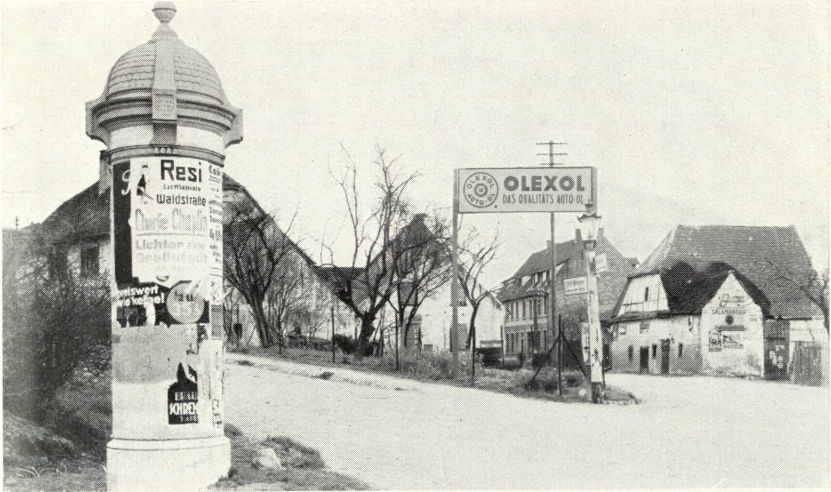
Segen der Neuzeit im Heimatbild.