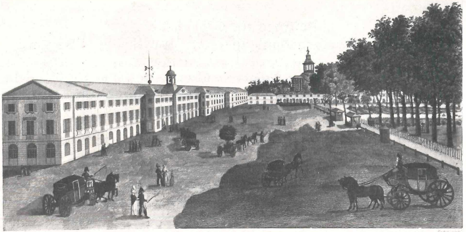
VUE DE LA NOUVELLE GALERIE

du Cabinet d'Histoire Naturelle au Muséum National d'histoire naturelle