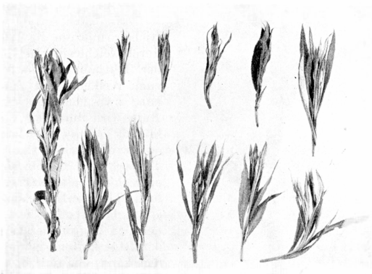
Fig. 2. Von Pselaphorhynchites tomentosus Gyll. abgeschnittene Weidentriebspitzen. ca. \frac{1}{3} .

P. tomentosus geht darin sehr gründlich vor, indem er ein Stück der Triebspitze mit einem sehr gerade geführten Schnitt einfach abschneidet