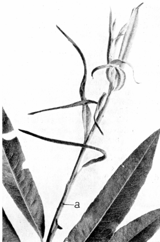
Fig. 1. Nach Brutfraß von Rhynchaenus stigma Germ. absterbende Weiden-Triebspitze. a: Einbohröffnung mit Deckel. Nat. Gr.

Die Eiablage des Käfers läßt sich in Petrischalen unter der Lupe leicht beobachten, da das Tier, wenn es erst einmal mit dem Einstich begonnen hat, sich nicht stören läßt. Das Weibchen sitzt in der Längsrichtung der Triebachse, — bei stehenden Trieben kopfabwärts — und nagt ununter-