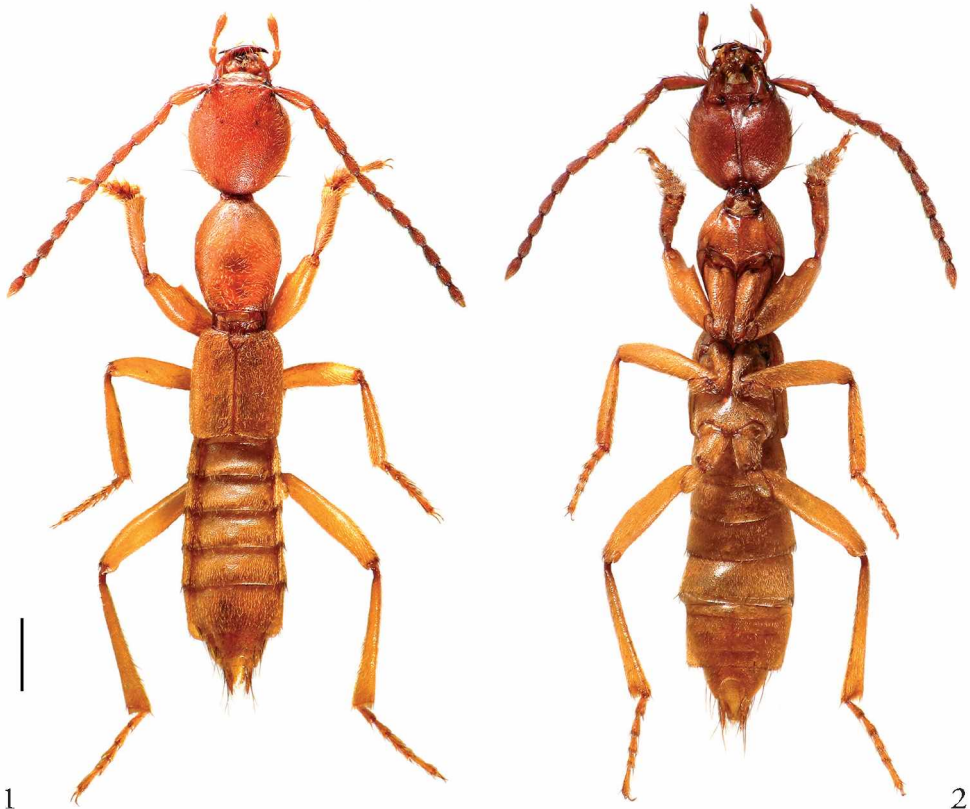
Fig. 1-2: Domene behnei sp. n. (Maßstab 1 mm). 1 Habitus. 2 Unterseite.

Habitus (Fig. 1-2). Schwach pigmentiert. Kopf, Antennenbasis und Mundteile dunkler rotbraun. Antennen vom Glied IV an etwas dunkler. Pronotum etwas heller rotbraun. Elytren, Abdomen und Beine rotgelb. Punktur fein und dicht. Behaarung kurz und anliegend. Lange Tastaare an den Schläfen, auf der Stirn, im Nackenbereich, im Apikalbereich des Abdomens und etwas kürzere an den Tergit-Hinterrändern (Fig. 1-5).