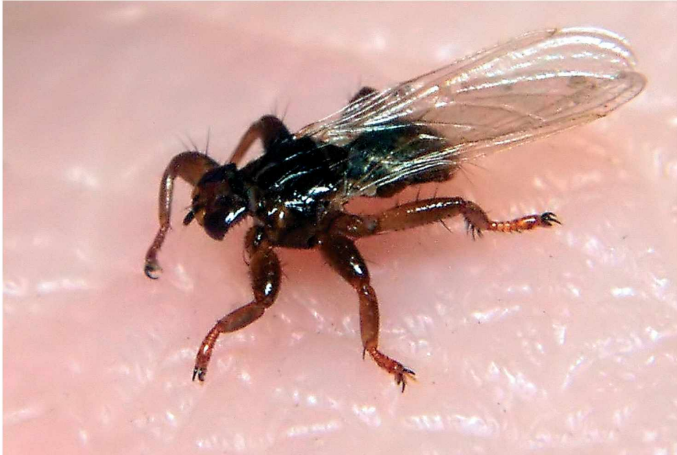
Fig. 2: Lipoptena cervi (LINNAEUS) – Funddaten: Mecklenburg-Vorpommern, Dobbin SW von Dobbertin, Forst Barkhorst, Juni 2004).

14°06'25"E (Fundpunkt 21), 53 m ü. NN, Laubwald (Rotbuche, Hainbuche, Stieleiche), 26.09.2002, leg. Menzel; 1 ♀, Gegenseer Teerofen S von Hintersee, 53°35'52"N 14°15'00"E (Fundpunkt 7), 10 m ü. NN, Mischwald (Kiefer, Fichte, Rotbuche, Traubeneiche) mit Erlen-Birken-Bruch, 27.09.2001, leg. Menzel; 9 ♀ ♀, Gorkow N von Löcknitz, 53°29'14"N 14°12'21"E (Fundpunkt 16), 11 m ü. NN, Mischwald (Kiefer, Stieleiche, Birke), 26.09.2002, leg. Menzel; 2 ♀ ♀, Groß Miltzow E von Strasburg, 53°31'22"N 13°35'43"E (Fundpunkt 14), 87 m ü. NN, Laubwald (Stieleiche, Bergahorn, Esche, Zwischenlinde, Birke, Holunder), 24.09.2001, leg. Menzel; 3 ♀ ♀, Grünhof N von Rothenklempenow, 53°32'32"N 14°13'21"E (Fundpunkt 13), 5 m ü. NN, Nadelwald (Kiefer, Fichte), 27.09.2001, leg. Menzel; 9 ♀ ♀, Hohenfelde SE von Blankensee, 53°29'14"N 14°19'17"E (Fundpunkt 17), 31 m ü. NN, Mischwald (Kiefer, Fichte, Stieleiche, Birke, Eberesche), 28.09.2002, leg. Menzel; 1 ♀, N von Jatznick, 53°35'29"N 13°56'04"E (Fundpunkt 9), 25 m ü. NN, Laubwald (Rotbuche, Traubeneiche) mit Erlen-Birken-Bruch, 26.09.2001, leg. Menzel; 1 ♀, Nettelgrund SE von Rothemühl, 53°35'38"N 13°50'53"E (Fundpunkt 8), 23 m ü. NN, Mischwald (Rotbuche, Kiefer); 25.09.2001, leg. Menzel; 1 ♀, Sommersdorf SW von Penkun, 53°17'15"N 14°12'06"E (Fundpunkt 38), 50 m ü. NN, Nadelwald (Kiefer, Fichte, Lärche) mit Rotbuche, Bergahorn, Spitzahorn, Hainbuche und Winterlinde, 27.09.2002, leg. Menzel.