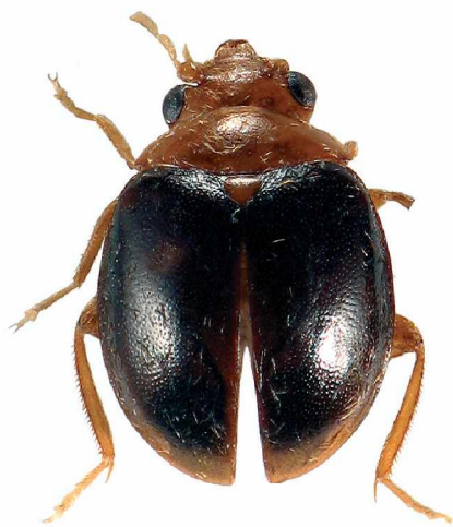
Fig. 1: Prionoscirtes reliquus , Habitus, dorsal.

7. Sternit braun, hintere Hälfte und Ränder heller, hinten halbkreisförmig eingebuchtet (Fig. 3). Maximale Breite 1,10-1,18 mm; maximale Länge neben der Bucht 0,29-0,30 mm; die Bucht ist 0,04 mm tief.