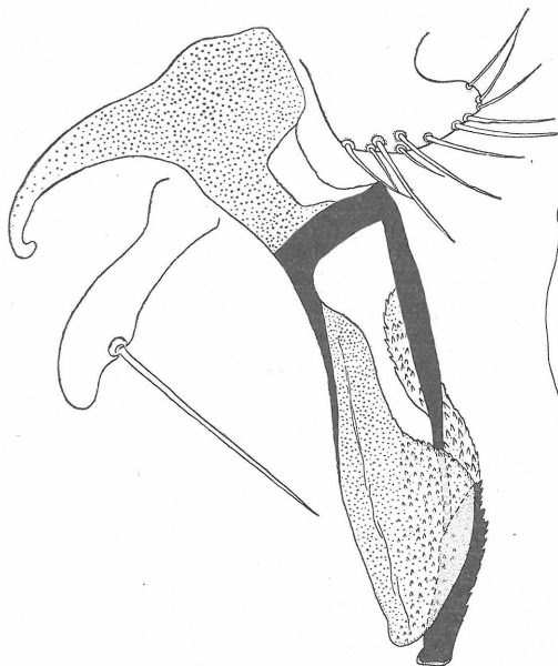
Fig. 1. Rhyncomyia speciosa (Loew). Phallosom, Seitenansicht