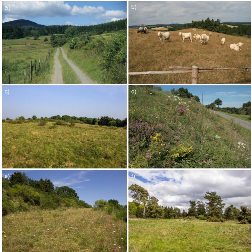
Abb. 2: (a) Mosaik aus Wiesen, Weiden, Säumen und Hecken bei Medelon (Foto: T. Fartmann, Juni 2002); (b) der Aarberg bei Eppe mit den drei besonders wertgebenden Arten Delphacinus mesomelas , Jassidaeus lugubris und Xanthodelphax flaveola wird von Rindern beweidet (Foto: D. Poniatowski, Juli 2010); (c) die extensive Rinderweide „Am Knapp“ gehört mit über 40 Arten zu den artenreichsten Flächen im UG (Foto: F. Helbing, August 2015); (d) der Galgenberg bei Münden mit 8 Trockenrasen-Spezialisten und 15 gefährdeten Arten liegt im klimatisch begünstigten Osten des UG (Foto: D. Poniatowski, August 2011); (e) auch auf dem Gelängeberg leben über 40 Zikadenarten (Foto: F. Helbing, Juli 2014); (f) die artenreiche Medebacher Heide ist eine extensive Schafweide (Foto: F. Helbing, Mai 2014).

Fig. 2: (a) A mosaic of meadows, pastures, margins and hedgerows near Medelon (Photo: T. Fartmann, June 2002); (b) the cattle pasture “Aarberg” holds three valuable species: Delphacinus mesomelas , Jassidaeus lugubris und Xanthodelphax flaveola (Photo: D. Poniatowski, July 2010); (c) “Am Knapp” is one of the most diverse sites in the study area (Photo: F. Helbing, August 2015); (d) the “Galgenberg” is located in the warmest and driest part of the study area harboring all of the 8 xerothermophilous specialists and 15 threatened species (Photo: D. Poniatowski, August 2011); (e) an acidic grassland at the “Gelängeberg” with more than 40 species (Photo: F. Helbing, July 2014); (f) the sheep pasture “Medebacher Heide” holds a diverse Auchenorrhyncha fauna (Photo: F. Helbing, May 2014).