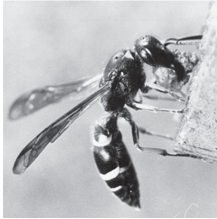
Abb. 3 Die Wespe ist mit einem Lehmklumpen, den sie zwischen den Mandibeln hält, an der Brutröhre gelandet, um die Brutzelle zu verschließen.

Die Beobachtungen lassen die Schlussfolgerung zu, daß für Symmorphus crassicornis der „Eikontakt“ als indirektes Maß der in einer Brutzelle einzulagernden Beutemenge dient. Der absolute Meßparameter liegt dabei aber völlig im