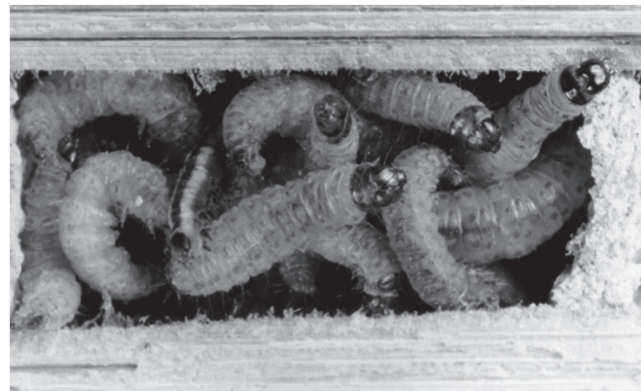
Abb. 2 Blick von oben in das Innere einer mit Blattwespenlarven vollgepackten Brutzelle. Hierzu wurde der obere Teil des Rohres entfernt.

Das Tier schlägt mit einem Fühler gegen das Ei und biegt unmittelbar danach – also noch vor Rückschlag des Eies – den vorderen Teil der Antenne leicht ein. Mit diesem eingebogenen Teil der Antenne fängt die Wespe das zurückpendelnde Ei schon beim ersten Rückschlag ab. Der Fühler löst sich so schnell wieder vom pendelnden Ei, daß die Antenne beim zweiten Pendelrückschlag nicht mehr gestreift wird. Die Wespe bewegt die Antenne in Richtung der eingelagerten Blattwespenlarven. Dort ruht während des gesamten Ablaufs des geschilderten Verhaltens die zweite Antenne. Der Pendelschlag erfolgt beim Einbringen der Beute immer nur jeweils ein einziges Mal. Dieser immer wieder gleiche Verhaltensablauf kann nicht zufällig sein.