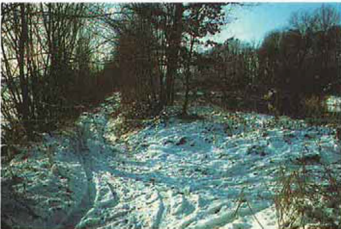
6: links Salzach; rechts Altwasser aus Bild 5; dazwischen Deich mit Weg auf dem die Biber den Großteil ihrer Nahrung ernten