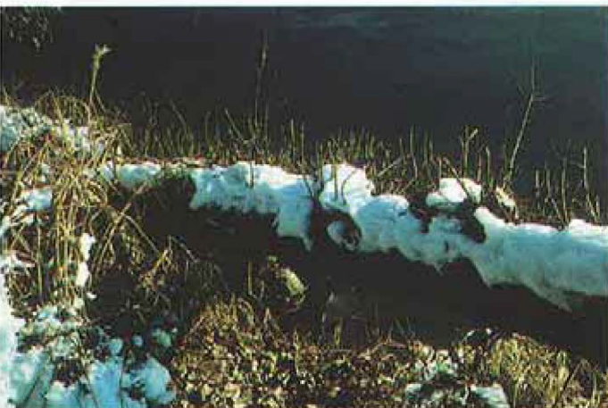
8: Nutzung von jungen Trieben einer alten Fällung/Windbruch am Deich v. Bild 6