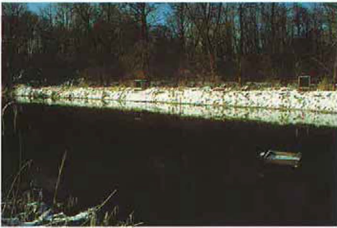
5: Altwasserteich aus Revier A; Schutz- hütten für Angler und Jäger