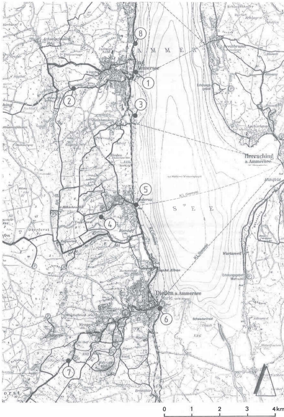
Abbildung 1 Lage der Probestellen