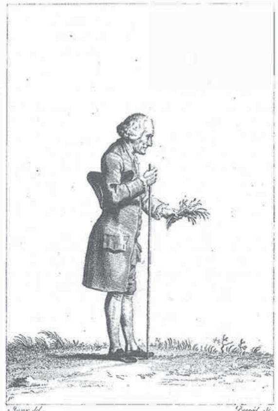
Venant d'herboriser dans les Jardins d'Ermenouville au mois de Juin 1778. Botanique.

Mit dem Biedermeier verwandelt sich der Gartenraum in eine Stätte bürgerlicher Intimität. Die meist kleinräumigen und vierteiligen Gärten bilden nunmehr – teils mit Versatzstücken einer imaginierten Vergangenheit bestückte – grüne Binnenräume, Pflanzen und Haustiere dringen in den Wohnbereich ein. 3) Für die Gartenphilosophie des 19. Jahrhunderts erscheint das Leitbild einer „Einheit von Idylle und Fortschritt“ kennzeichnend (SENGLE); emblematische Beispiele dafür bilden die liberalen Gartentopographien aus Berthold Auerbachs Erzählung Die Sträflinge (1845) und Ferdinand von Saars Novelle Die Steinklopfer (1873), in denen Gärten um Häuschen an Eisenbahnlinien errichtet werden. 4)