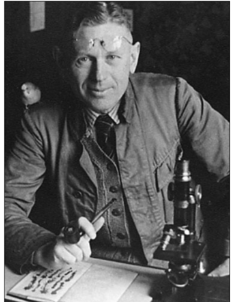
Abb. 1 Franz Elmendorff, um 1939.

Im Gegensatz zu den alten Botanikern, welche jede Pflanze für sich betrachteten, sehen wir die Pflanzendecke unserer Heimat gegliedert in Lebensgemeinschaften, in welchen die einzelnen Elemente voneinander abhängig sind.