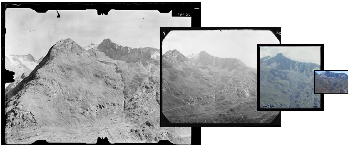
Bildformate der oben abgebildeten Aufnahmesysteme im Größenvergleich