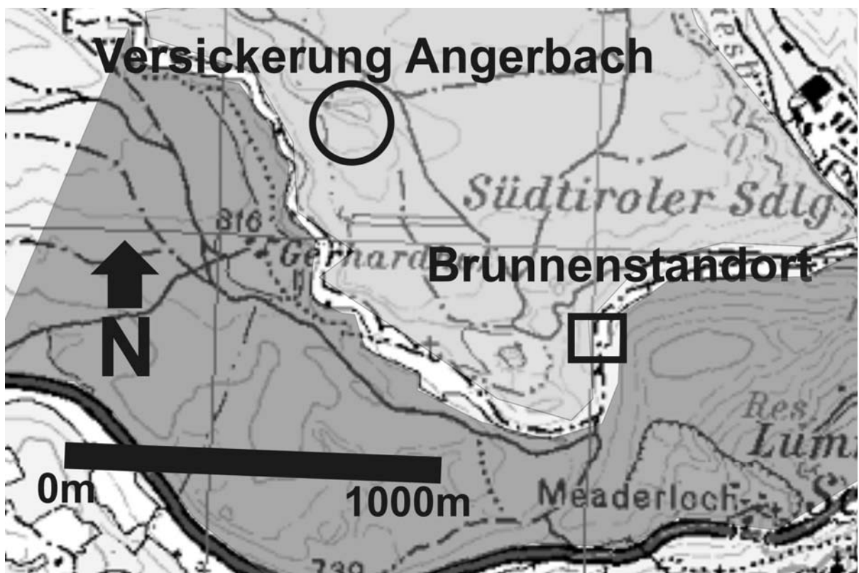
Abb. 1b - Detailübersicht. Hellgrau: Lokale, kalkaline Glazialsedimente; Dunkelgrau: Kristalline Glazialsedimente (Inntalmoräne); dazwischen das spätglazial kalkalpin verfüllte Trockental.