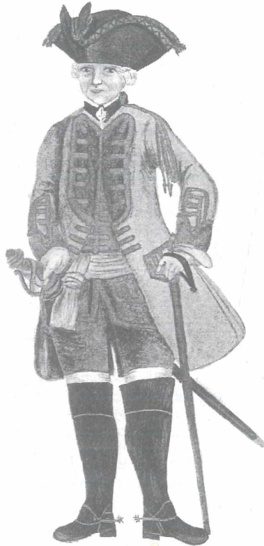
Abb. 19: Offizier des Ingenieurkorps 1764

Der Leiter der Schule, General Georg Josua du Plat (1722-1795) setzte sich dafür ein, daß seine Offiziere eine wissenschaftliche