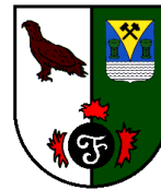
Abb. 1 Verbandsabzeichen des Truppenübungsplatzes: Farben des Freistaates Sachsen; Wappen der Stadt Weißwasser; Seeadler als Schutzziel; Feuerwerker- symbol steht für die Hauptaufgabe des TrÜbPl.

Im Bereich des jetzigen Großkraftwerkes Boxberg – südlich der Ortschaft Nochten – begann nach 1945 die Entstehungsgeschichte des Truppenübungsplatzes (TrÜbPl) Oberlausitz. Zunächst wurde hier durch die Sowjetarmee ein Panzerschießplatz und ein Truppenlager errichtet und genutzt. Anfang der 1950er Jahre übernahm die Kasernierte Volkspolizei diese Anlagen. 1956 wurde der Platz durch die NVA in Nutzung genommen.