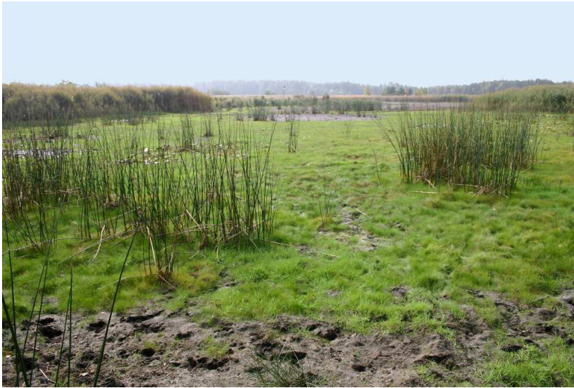
Abb. 1: Der Große Tiefzug (Blick vom Ostufer) bietet weiträumige Siedlungsflächen für Luronium natans (28.9.2006).