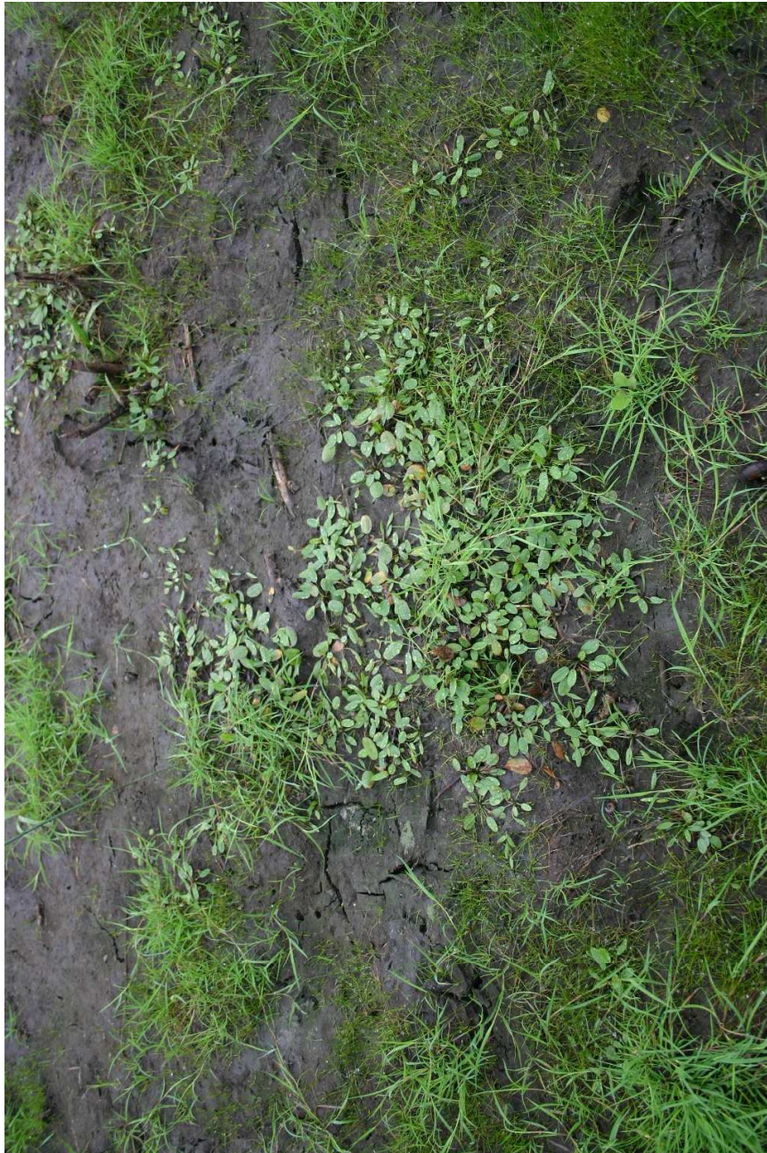
Abb. 3: Jungpflanzen von Luronium natans auf bis zu ca. 40 cm starker Teichgyttja wachsend und Landformen ausbildend (28.9.2006).