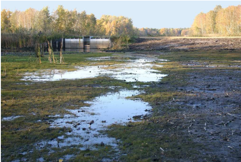
Abb. 2: Der durch einen Damm mit Ablassbauwerk vom Fraunteich (Hintergrund) separierte Froschteich. Rechts im Bild die im Winter 2005 entlandete zentrale Teichfläche, auf der sich 2006 zahlreiche Luronium natans ansiedelte (8.11.2006).