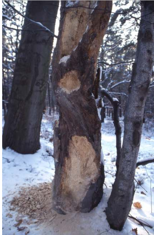
Abb. 5 Als Lebensraum und Nahrungsspeicher für verschiedene Tiere belassenes Totholz von Rotbuche mit Stockausschlag. Foto Friedhard Förster, November 1998

Die Waldflächen des überwiegenden Teiles des Naturschutzgebietes gehören zwei Großprivatwaldbesitzern. Hervorzuheben ist die aus naturschutzfachlicher Sicht begrüßenswerte Einstellung zum Belassen eines Teiles des durch den Sturm „Kyrill“ am 18.01.2007 geschädigten Laubholzes im Bestand. Dadurch werden sich in den nächsten Jahren starke Rotbuchen zu stehendem Totholz entwickeln können (Abb. 5). Beräumt und genutzt wurde insbesondere das umgebrochene Nadelholz sowie Laubholz in den Fällen, wenn die Verkehrssicherheit nicht mehr gewährleistet war.