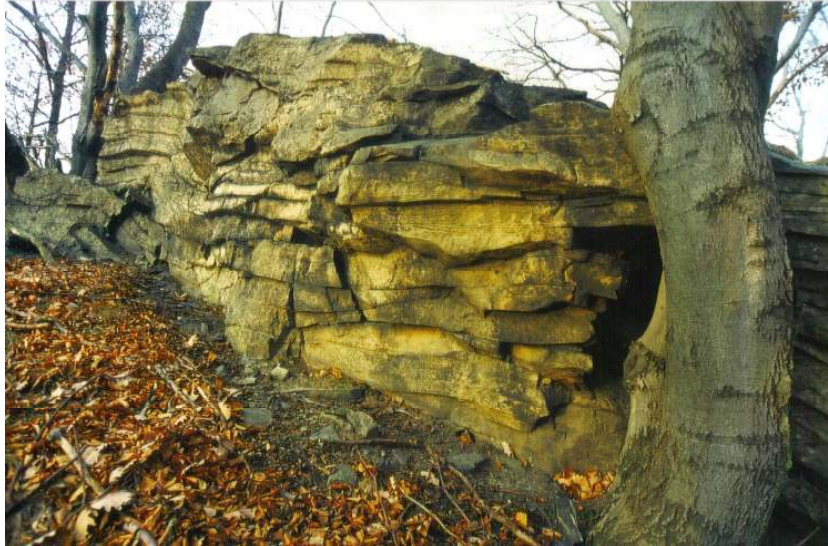
Abb. 1 Feinkörniger Dubrau-Quarzit an der Oberfläche der Gesteinsablagerungen, mit quarzitischen Faltnngen. Foto Friedhard Förster, November 2002