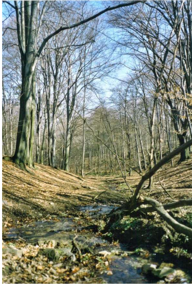
Abb. 2 Typische hallenartige Ausbildung des Hainsimsen-Buchenwaldes im Bereich der „Wolfsschlucht“. Foto Johannes Förster, April 2001

Die Quellstandorte der Bachtälchen, die Bachtälchen, ihre Abflüsse und die Sickerstümpfe sind im Bereich ihrer Abflüsse nicht einheitlich ausgebildet und werden von den umliegenden Waldbeständen stark beeinflusst. Zusammenfassend können sie etwa den Erlen-Eschen-Bach- und Quellwäldern (Remotae-Alnetum LEMEE 37) zugeordnet werden, wobei die Eschen zurücktreten bzw. ganz fehlen. Dafür treten zu den Erlen an lichten Stellen Birken. Das Wolfsschlucht-Bachtälchen (Abb. 2) ist im Oberlauf teilweise so engkerbig, dass die Bäume des Traubeneichen-(Kiefern)-Buchenwaldes bis an den Wasserlauf reichen. Das Quellgebiet dieses Bachtälchens ist als Erlen-Quellmoor ausgebildet und wird von den darüber liegenden Ackerflächen mit Nährstoffen belastet. Der oberhalb der Kleinteiche liegende Sickersumpf (Remotae-Alnetum LEMEE 37) des Wolfsbachtälchens ist wahrscheinlich im Laufe des 18. bis 19. Jahrhunderts durch die Anlage der Kleinteiche aufgestaut worden.