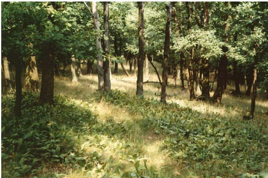
Abb. 4 Traubeneichenwald mit Maiglöckchen am Westgipfel. Foto Christian Klouda, August 2000