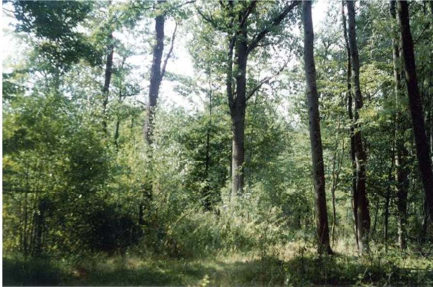
Abb. 3 Wuchsfreudiger Traubeneichen-Buchenwald mit Stieleiche und Hainbuche am Unterhang des Westgipfels. Foto Christian Klouda, August 2000