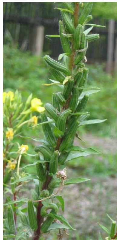
Abb. 3–5 Geranium rotundifolium (oben), Oenothera flaevingina (unten rechts und links)