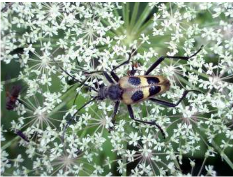
Abb. 5 Pachyta quadrimaculata.