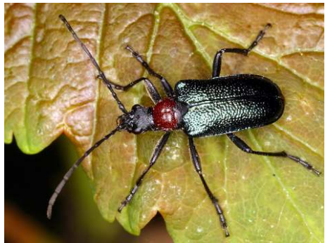
Abb. 6 Gaurotes virginea .