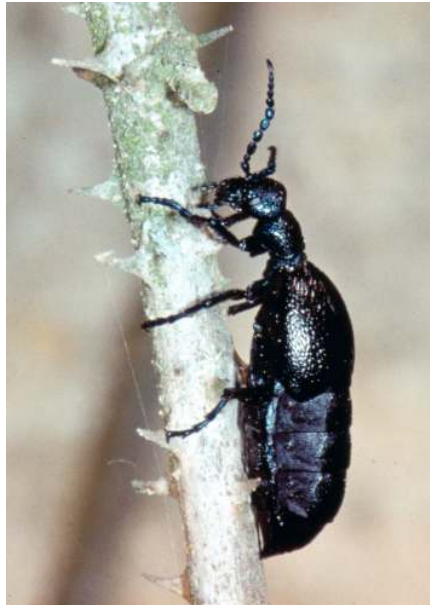
Abb. 4 Meloe proscarabaeus , Weibchen.