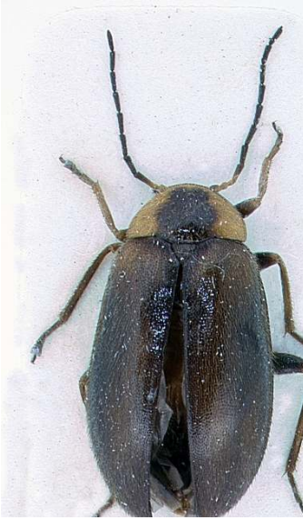
Abb. 2 Odeles marginata , Weibchen, Habitus, dorsal.