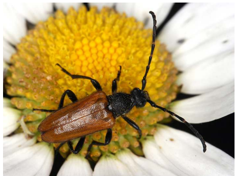
Abb. 8 Paracorymbia maculicornis .