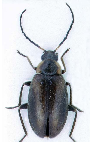
Abb. 3 Odeles marginata , Männchen, Habitus, dorsal.