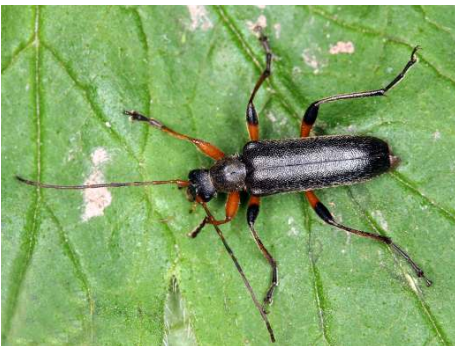
Abb. 7 Cortodera femorata . Foto E. Wachmann