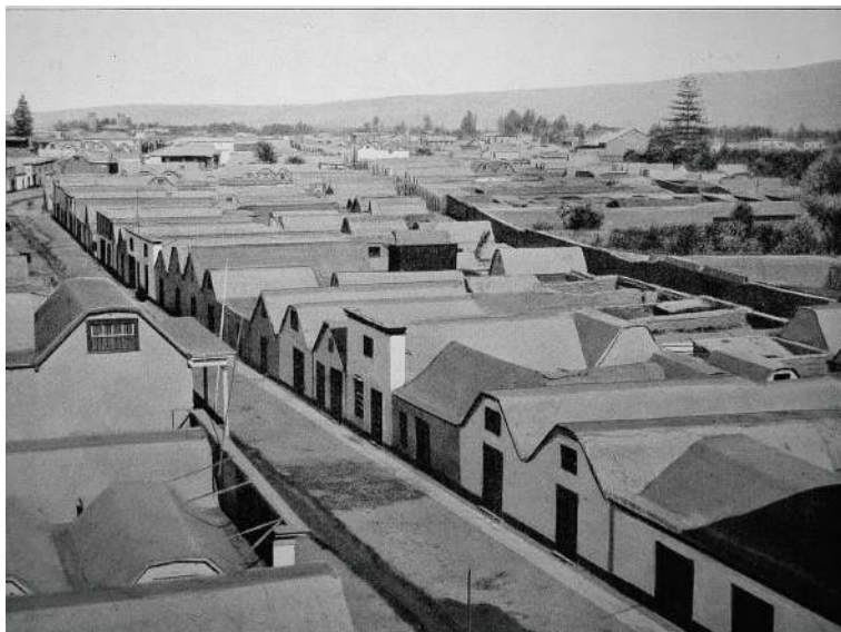
Abb. 1 Tacna um 1900.