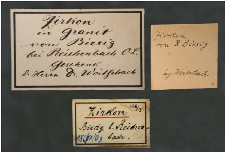
Abb. 4 Etiketten zur Zirkonstufe aus Biesig (Königshainer Granitstock), gesammelt von Georg Woitschach. Sammlungs-Nummer 00736 des Senckenberg Museums für Naturkunde Görlitz. Rechts: Originaletikett von G. Woitschach.

Untersuchungen des Lignites im pflanzenphysiologischen Institut der Universität Breslau mit Bestimmung der Pollenzusammensetzung (z.B. Pinus , Alnus , Betula , Ulmus ) und der Holzreste ( Alnus , Salix , Pinus ) wurde hier gegeben.