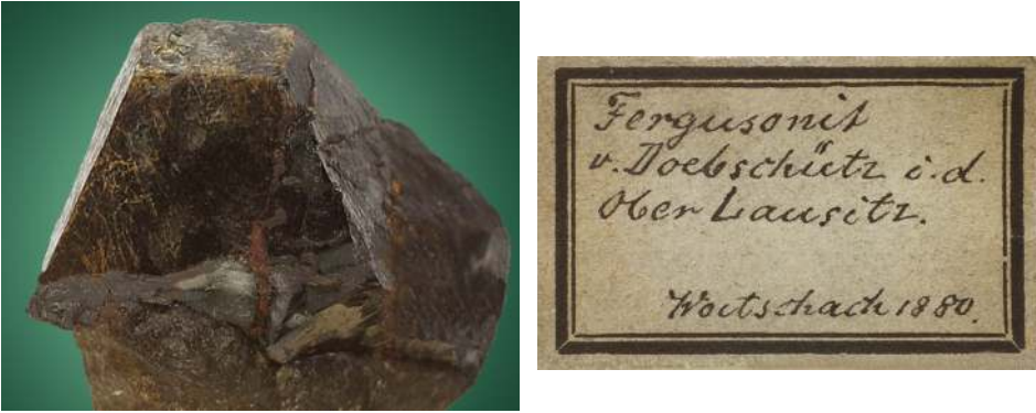
Abb. 3-1 und 3-2 Fergusonit aus Döbschütz (Königshainer Granitstock), gesammelt von Georg Woitschach: Kristall mit dazugehörigem Etikett. Sammlung: Muzeum Mineralogiczne, Wrocław; Nr. II 4921. Nach WITZKE & GIESLER (2001) sind die von ihnen untersuchten Fergusonitproben aus dem Naturkundemuseum Görlitz eine Fehlbestimmung und als Euxenit-(Y) anzusprechen. Der hier abgebildete Kristall wurde einer zerstörungsfreien raman-spektrometrischen Aufnahme unterworfen, deren Interpretation mit hoher Wahrscheinlichkeit Fergusonit vermuten lässt, aber keine vollständige Sicherheit bietet. Andere Untersuchungsmethoden wären mit Substanzverlusten am Mineral verbunden und konnten deshalb nicht durchgeführt werden.