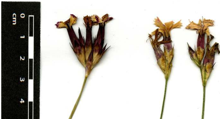
Abb. 1 links Dianthus giganteus , rechts Dianthus carthusianorum .