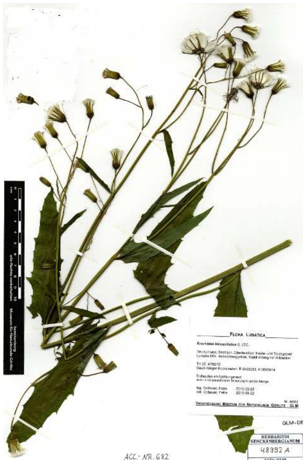
Abb. 2 Erechtites hieraciifolius .

OLT 4654/43 Niesky W: Guttau, OT Halbendorf/Spree, 1 Exemplar am Rande eines mit Wasser gefüllten Torfstiches (Beck, Weis).