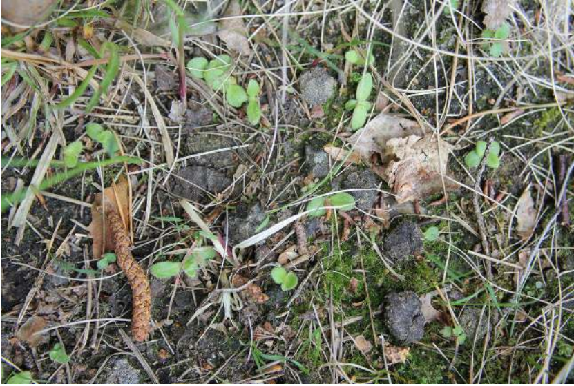
Abb. 1 Keimlinge von Arnica montana im ersten Frühjahr nach der Herbstsaat auf einer mageren Schafweide.