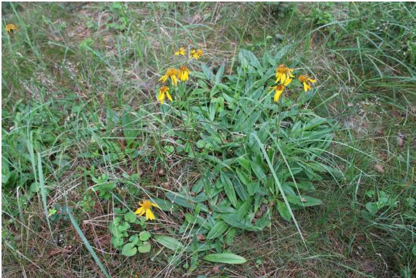
Abb. 2 Dichter Pulk von Arnica -Rosetten in einem Kiefernforst am Schwarzen Schöps. Foto Frank Richter 2012

Die Diasporen von Arnica montana bauen keine ausdauernde Samenbank auf. Sie können nur kurzzeitig (max. 2 Jahre) in der obersten Bodenschicht überdauern. Eine Regeneration der Art aus der Diasporenbank ist daher nicht zu erwarten.