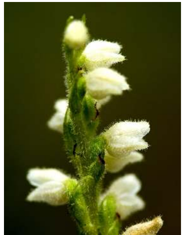
Abb. 1–3 Goodyera repens .