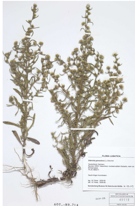
Abb. 2: Beleg von Stinkender Klebalant ( Dittrichia graveolens ) im Lausitzerherbar (GLM 49119) von M. Friese 2009.

OLH 5054/22 Zittau N: Herrnhut OT Großhennersdorf O, Schönbrunner Berg (Fischer).