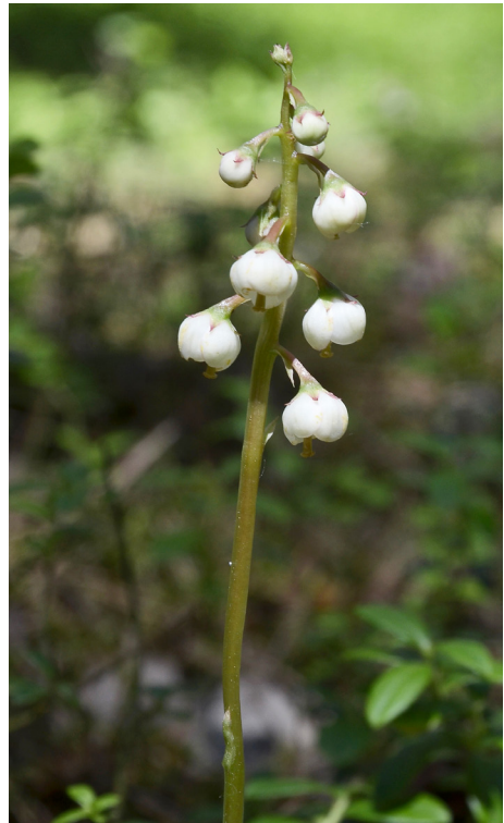
Abb. 1: Mittleres Wintergrün ( Pyrola media ), Blüten- stand.

Pyrola rotundifolia – Rundblättriges Wintergrün 1 OLH 4955/21 Görlitz SSW: Markersdorf OT Jauernick-Buschbach, Neuberzdorfer Höhe, Pappelforste, Wege und Säume, 25 Expl., 1 blühend (Wünsche). OLH 4955/23 Görlitz OT Tauchritz, Kippe Tagebau Berzdorf, westlich Sachsenhüt- te, Graben an Kiefernauflistung, 4 m 2 , 16 Expl. blühend (Wünsche).