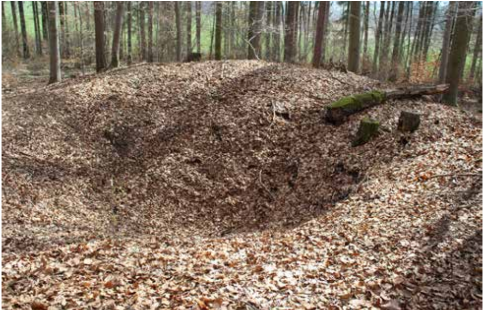
Abb. 4: Schachtpinge, Blick von WNW.

auf einer Wiese befand und die Nutzung als solche beeinträchtigte.