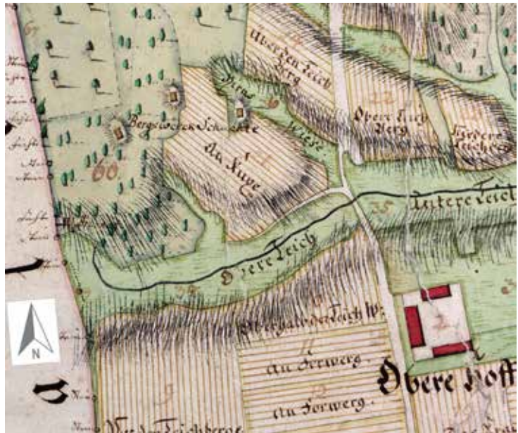
Abb. 1: Ausschnitt aus der Flurkarte von Berthelsdorf und Herrnhut (1764).