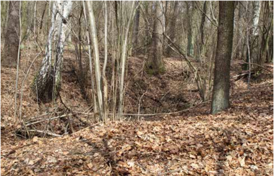
Abb. 3: Verbrochener Stolleneingang, Blick von SSO.