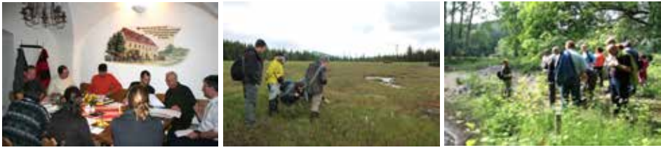
Abb. 1: a) Botanikstammtisch im November 2011. Foto: A. Schurig; b) Botanische Wanderung ins Isergebirge 2015. Foto: K. Sbrzesny; c) Exkursion zum Schülerbusch 2011. Foto: A. Schurig

zu fördern, treffen sich alle Interessierten seit Herbst 2010 zum Botanikstammtisch in Großhennersdorf (Abb. 1a).