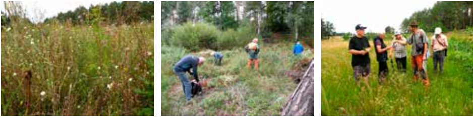
Abb. 4: a) Rasterkartierung; b) Pflege in der Sagoinza-Senke; c) Gemeinsame Exkursion am Schwarzen Schöps.

Hinzu kommt ein Exkursionsprogramm mit wechselnden Schwerpunkten in z.B. unterkartierten Landschaftsausschnitten im nördlichen Landkreis oder zu Fundorten anhand historischer Angaben: