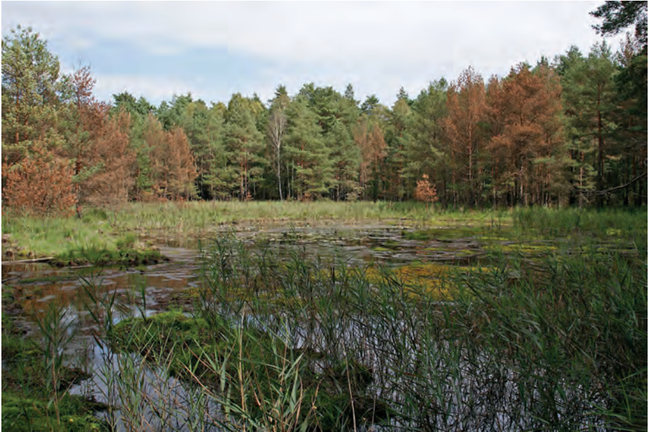
Abb. 5: Seerosensumpf bei Lömischau.

der Auflösung des Zoologischen Instituts der TU Dresden 1967 übernahm die Humboldt-Universität Berlin die Zoologische Feldstation und nutzte sie in gleichem Sinne. Die Betreuung oblag in dieser Zeit Joachim Schulze. 4 Die „Zoologische Feldstation der TU Dresden“ wurde in „Biologische Station der Humboldt-Universität Berlin“ umbenannt. Sie bestand bis ca. 1986.