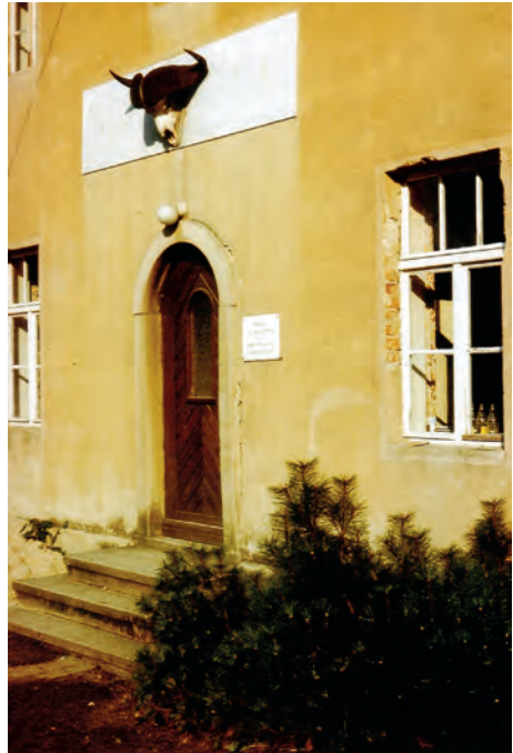
Abb. 4: Zoologische Feldstation Guttau, Eingangsbereich, 1986.

Nun entstand dort ein zoologisches – vorwiegend entomologisches – Leben, das große Auswirkungen auf die Erforschung der Oberlausitz hatte. Diplomanden von Jordan und seinem Amtsnachfolger Sedlag hatten dort ihr