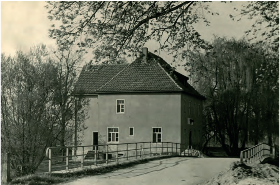
Abb. 3: Zoologische Feldstation Gutttau.