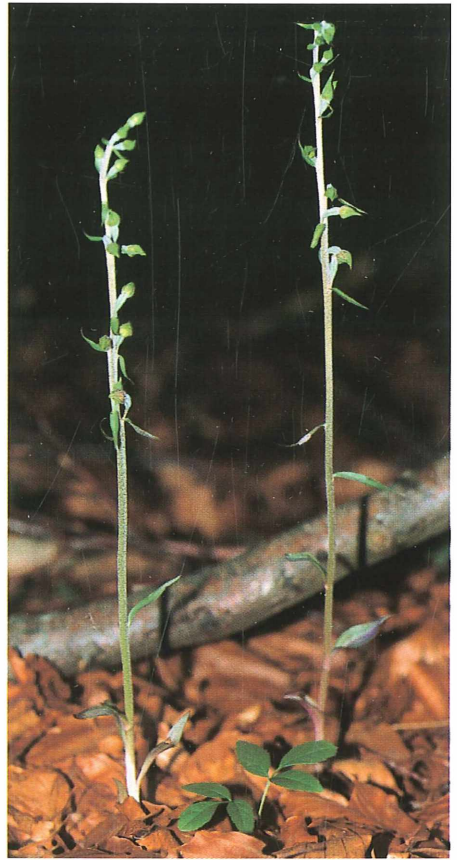
Abb. 2: Epipactis microphylla – Hörtwald bei Bayersried