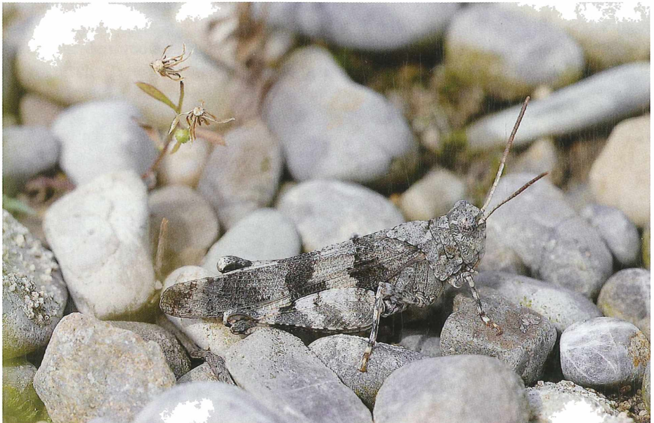
Abb. 3: Blauflügelige Ödlandschrecke Oedipoda caerulescens , 30.07.2007

Unter heutigen Bedingungen, d.h. bei ungehinderter Sukzession, können autotypische Pionierarten wie O. caerulescens allerdings auf Dauer nur überleben, wenn ihre Habitatstrukturen immer aufs Neue künstlich geschaffen werden. Dass dies relativ einfach möglich ist, beweist der Erhalt von O. caerulescens im Naturdenkmal