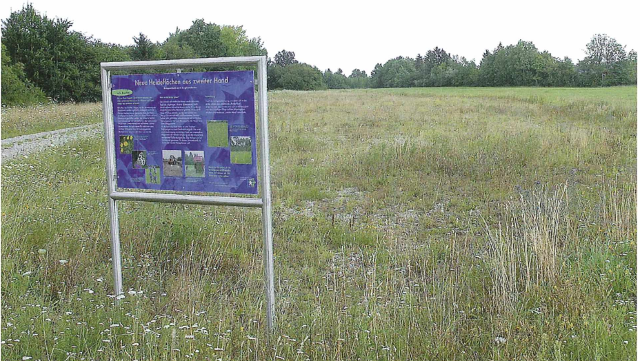
Abb. 2: „Heide aus zweiter Hand“ im Bereich des ehemaligen Hurlacher Schaf- triebtes. 30.07.2007