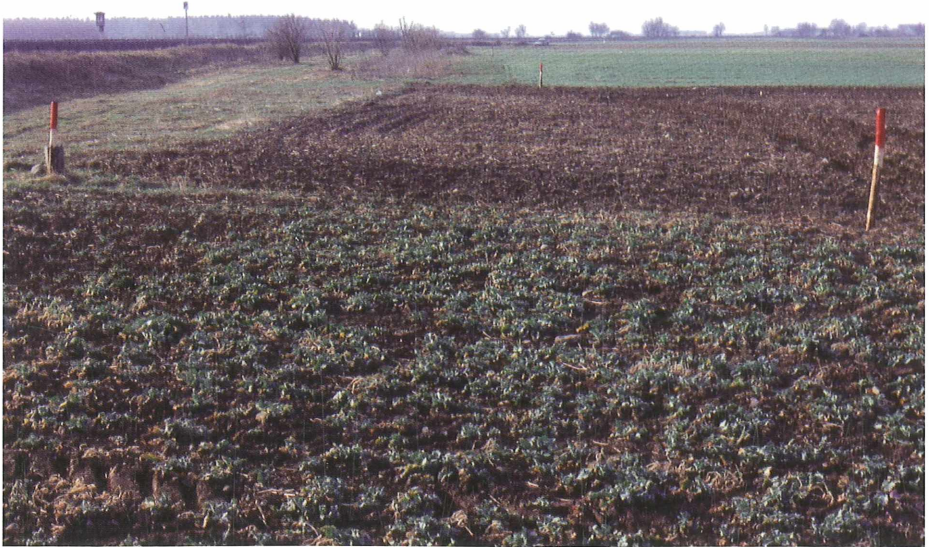
Abb. 3: Biotopfläche nur 8 Meter breit

Die Lebensgemeinschaften auf den Trocken- und Halbtrockenrasen brauchen als Mindestgröße Flächen von ca. 1 ha (Heuschrecken, Schmetterlinge) und bis ca. 3 ha (Zauneidechsen, Laufkäfer, Feldgrille). Diese Größenangaben gelten für Flächen, die mit entsprechenden Nachbarflächen in Kontakt stehen.