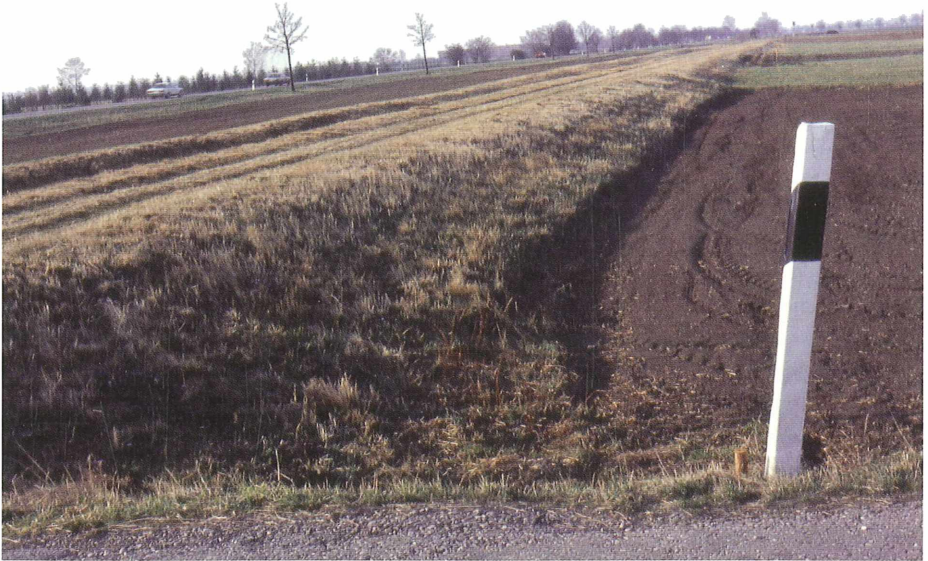
Abb. 4: Alzustand westlich der Bahn 1981

Der Biomasseentzug, in der Form einer Turnus-Pflegemahd mit dem Balkenmäher, mit Abfahren und Kompostieren des Mähgutes, sowie das Entfernen von aufkommenden Einzelgehölzen, ist aufgrund des vorliegenden Entwicklungs- und Pflegeplanes jedes Jahr von Neuem dringend notwendig. Er soll damit der Eutrophierung (Anreicherung mit Nährstoffen durch Düngemittel aus den benachbarten landwirtschaftlichen Anbauflächen oder aus der Luft) entgegen wirken.