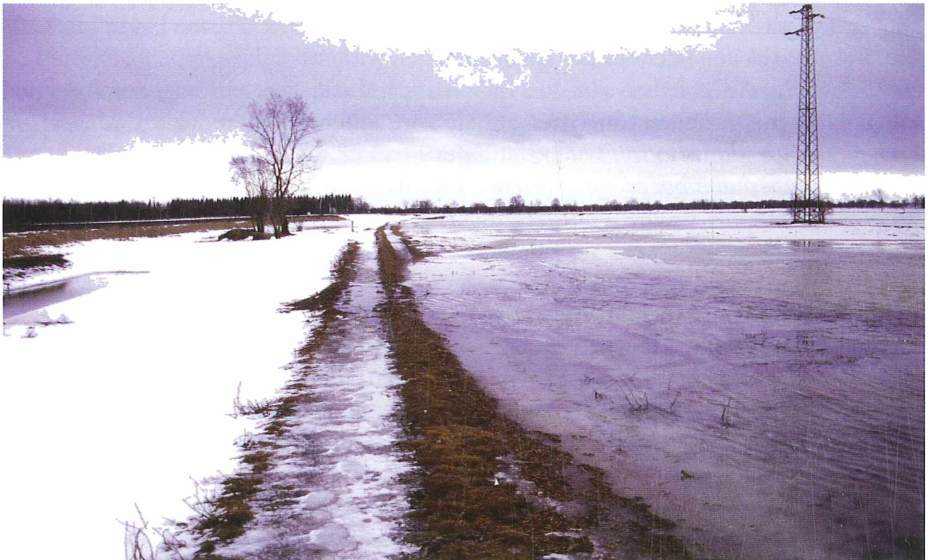
Abb. 5: Schneeschmelzwasser

Aufgrund der Sukzession der Vegetation in den Biotopflächen (teilflächig 40 cm hohen Bewuchs mit massiv aufkommender Verbuschung) ist derzeit dringender Handlungsbedarf, insbesondere auf den Flächen 9 bis 13 geboten, um langfristig gesehen, weitere Arteneinbußen zu verhindern. Bisherige Pflegemaßnahmen haben zwar die Sukzession weitgehend aufhalten und z.T. rückführen können, jedoch noch keine durchschlagende Verbesserung der Lage gebracht.