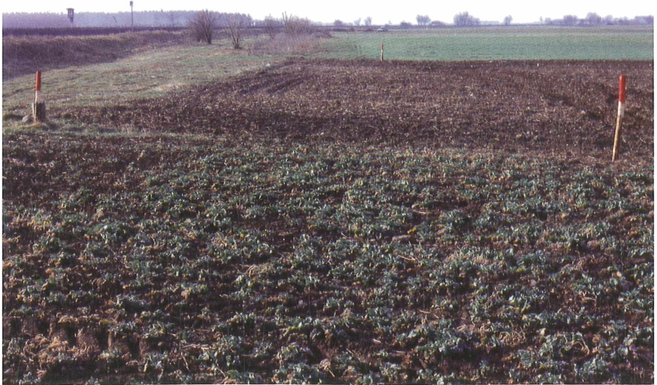
Abb. 3: Biotopfläche nur 8 Meter breit

Die Lebensgemeinschaften auf den Trocken- und Halbtrockenrasen brauchen als Mindestgröße Flächen von ca. 1 ha (Heuschrecken, Schmetterlinge) und bis ca. 3 ha (Zauneidechsen, Laufkäfer, Feldgrille). Diese Größenangaben gelten für Flächen, die mit entsprechenden Nachbarflächen in Kontakt stehen.