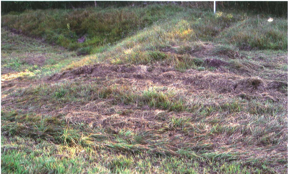
Abb. 7: Landwirtschaftliche Pflegemängel

Kein Schäfer zieht heute noch, wie früher geschehen, mit 20 Schafe über das Lechfeld. Die heutige erforderliche Herdengröße (600–800 Stück) erfordert große, verkehrsfreie Flächen. Die Schafe müssen mit einem hohen Kostenaufwand an- und abtransportiert werden. Die Flächen westlich der Bahn sind für die Schafbeweidung zu schmal. Außerhalb der Pflegeflächen müssten Pferch-, Tränk- und Zufutterplätze eingerichtet werden. Die Grasqualität ist für die Schafe neben einer landwirtschaftlichen Wiese zu unattraktiv, sie würden das Gras mehr zertrampeln als fressen.