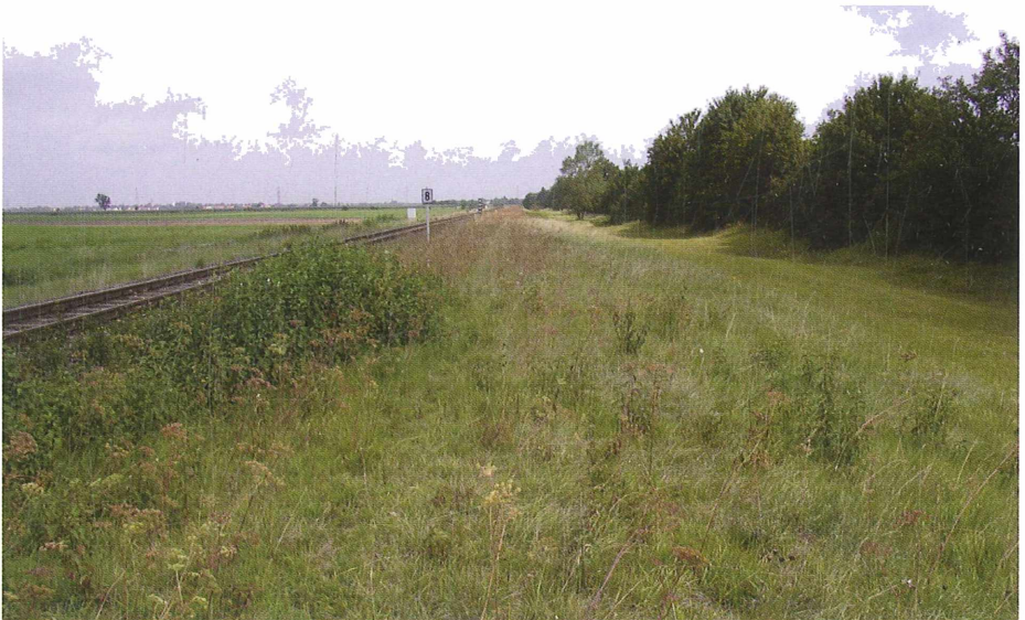
Abb. 6: Vernaumung der Gruben

Wegen der besonderen zu berücksichtigenden, außergewöhnlichen Erschwernisse, wie die kleinstrukturierten Flächen- und Geländeformation mit den oft versteckten Hindernissen auf der Mähfläche, die einen sehr hohen Materialverschleiß bewirken, können diese Biotopflächen auf dem Lechfeld mit den herkömmlichen landwirtschaftlichen Maschinen entweder schlecht, oder gar nicht bearbeitet werden. Landwirtschaftliche Betriebe waren in der Vergangenheit für die Bearbeitung dieser