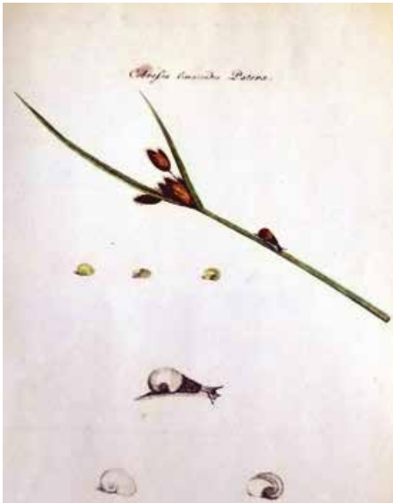
Abb. 8: Cobresia limacoides Patera, nach Jacob Hübner eine baierische Landschnecke, zur Gattung der Testazeen gehörig, deren Stammbezeichnung er zu Ehren von Joseph Paul von Cobres benannte.

Cobresia helicoides vitrea [aktuelle Nomenklatur: Eucoberesia diaphana ].