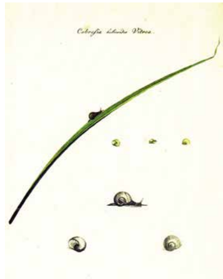
Abb. 9: Cobresia helicoides Vitrea, nach Jacob Hübner eine baierische Landschnecke, zur Gattung der Testazeen gehörig, deren Stammbezeichnung er zu Ehren von Joseph Paul von Cobres benannte.