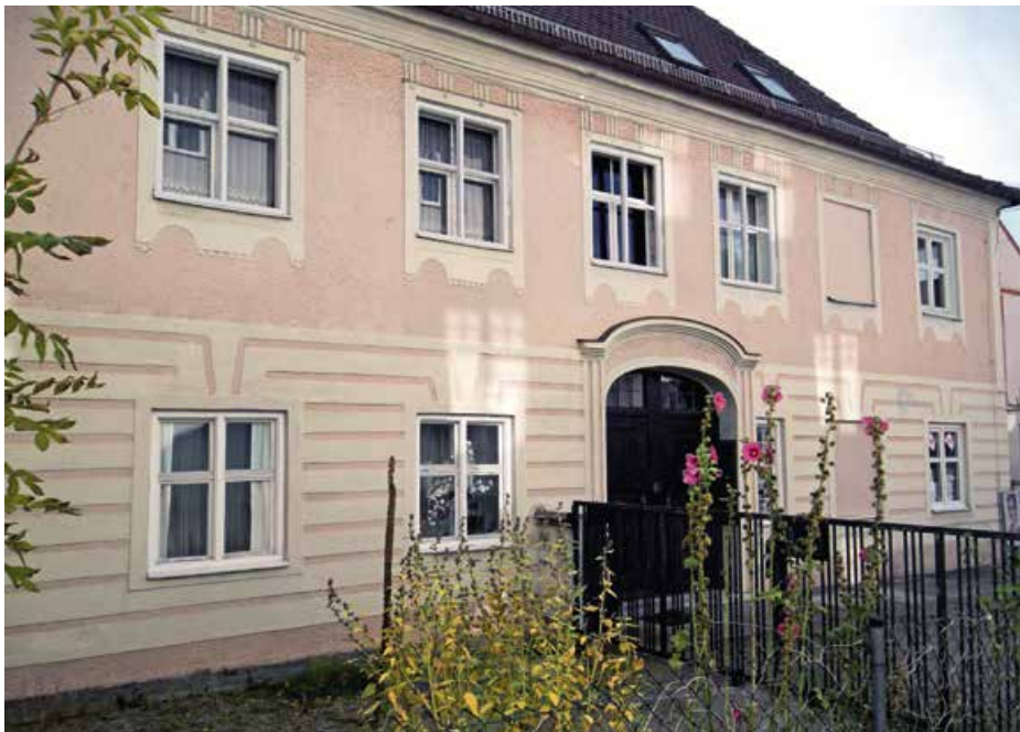
Abb. 4: Die Sölde Nr. 22, ein ehemaliges Gartengut in Göggingen (heute: Bürgermeister-Aurnhammer-Straße 33), das der Ritter Joseph Paul von Cobres zeitweise bewohnte.

1793 erwarb der Reichsritter Joseph Paul von Cobres in Göggingen bei Augsburg die dem Hochstift Augsburg zinspflichtige Sölde Nr. 22, ein ehemaliges Gartengut. Die Bausubstanz ist bis heute erhalten. Das Anwesen befindet sich in der Bürgermeister-Aurnhammer-Straße 33. Dieses Haus bewohnte der Ritter von Cobres als Gutsherr viele Jahre. [Im bäuerlichen Wirtschaftsleben stand der Begriff Sölde für ein ländliches Hofgebäude mit einem Stück Gartenland ohne landwirtschaftliche Nutzung. Mit der Bezeichnung Sölde war eine bestimmte Größe des Haus- und Grundbesitzes verbun-