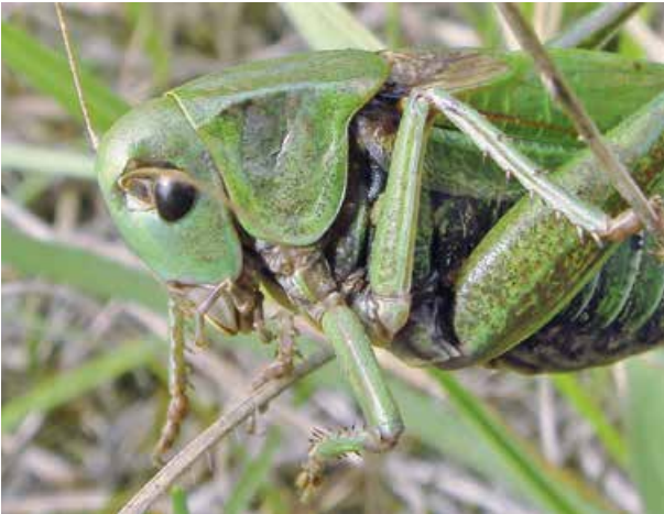
Abb. 4: Warzenbeisser auf der Schießplatzheide im Stadtwald Augsburg, 10.09.2014

Das einzige aktuelle Vorkommen des Warzenbeissers im Stadtgebiet liegt in der Schießplatzheide im Haunstetter Wald, weitere ehemalige Vorkommen (z. B. in der Königsbrunner Heide 1937, ASK) sind seit langem erloschen. In der Schießplatzheide ist die Art über weite Bereiche, jedoch nicht flächendeckend verbreitet. Lücken finden sich vor allem in den südlichen und nördlichen Teilflächen sowie im östlichen Bereich. Den Schwerpunkt bilden die vollsonnig gelegenen mageren und niedrigwüchsigen Bereiche.