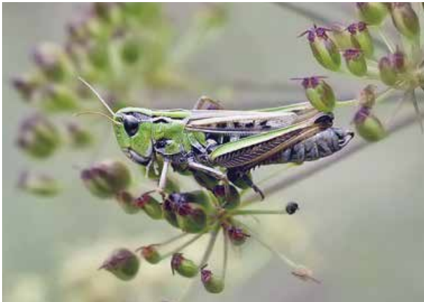
Abb. 5: Schwarzfleckiger Grashüpfer

Der Schwarzfleckige Grashüpfer wurde nur in der Königsbrunner Heide und in der Hasenheide festgestellt, von den anderen Untersuchungsgebieten sind – mit einer Ausnahme – auch aus früheren Jahren keine Nachweise bekannt. Bei der Ausnahme handelt es sich um den Nachweis weniger Tiere in den Lechbrennen Nord im Jahr 1999 (ÖKOKART 2000). Bei späteren Kontrollen konnte die Art dort nicht bestätigt werden (ÖKOKART 2007b) und auch aus früheren Jahren liegen aus dem Gebiet keine Meldungen vor (SCHLUMPRECHT & WAEBER 2003).