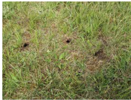
Abb. 3: 3 Wohnröhren von Feldgrillen in enger Nachbarschaft, Hasenheide 19.05.2014