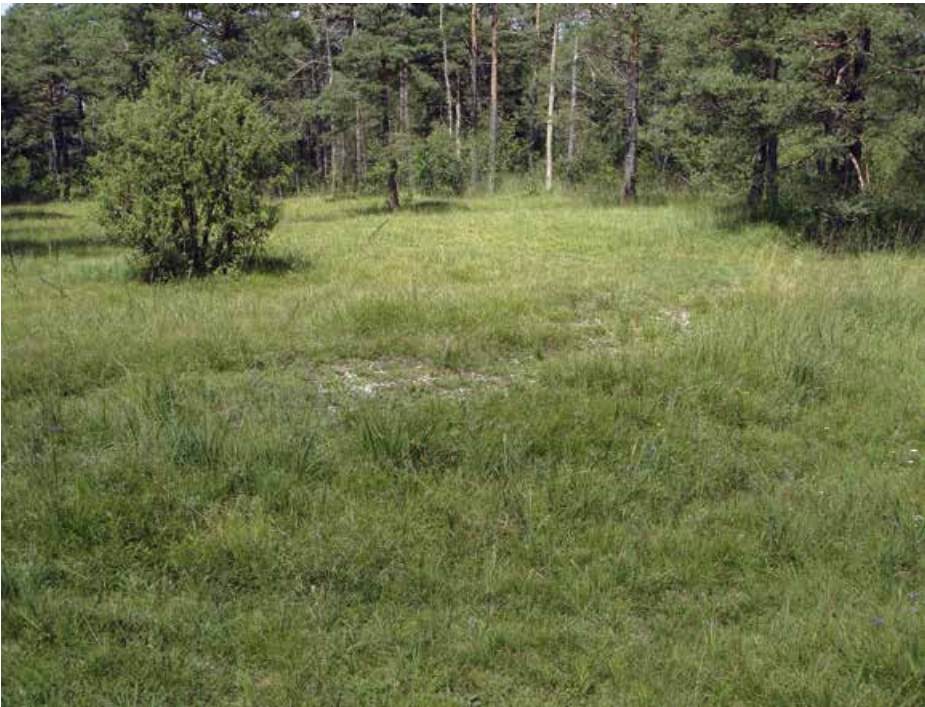
Abb. 6: Kuhheide, westl. Teilfläche A, Blickrichtung West, 08.08.2014: Kleinflächige Rohbodenstelle im Bereich einer Senke, Fundort der Zweipunkt-Dornschrecke

H = Häufigkeit: E = Einzelfund, SS = sehr selten, S = selten, R = regelmäßig, L = lokal, LH = lokal häufig, H = häufig