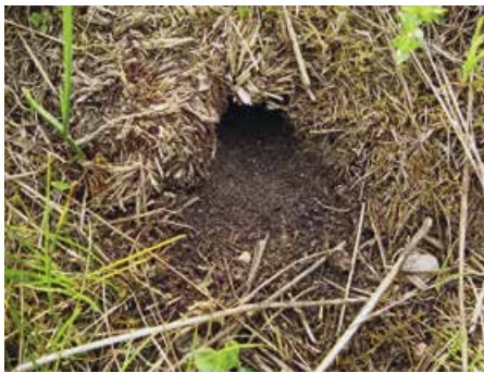
Abb. 2: Eingang zur Wohnröhre einer Feldgrille, Hasenheide 19.05.2014

Für die Erfassung der Feldgrille wurde eine Kombination aus Verhören und der Suche nach Wohnröhren eingesetzt. Dabei wurde – vor allem im Umfeld rufender Grillen, aber auch an anderen geeigneten Stellen – gezielt nach den bei lückiger und niedriger Vegetation gut erkennbaren Höhleneingängen Ausschau gehalten (Abb. 2, 3). In vielen Fällen konnten auf diese Weise mehr Grillen nachgewiesen werden als gleichzeitig zu hören waren. Voraussetzung hierfür ist jedoch eine sehr schwachwüchsige Vegetation, wie sie bei der Frühjahrsbegehung auf der beweideten Hasenheide vorgefunden wurde. Auf der nahegelegenen Königsbrunner Heide waren die Wohnröhren im niedrigen, aber dichten Bewuchs weit weniger auffällig und kaum zu finden.