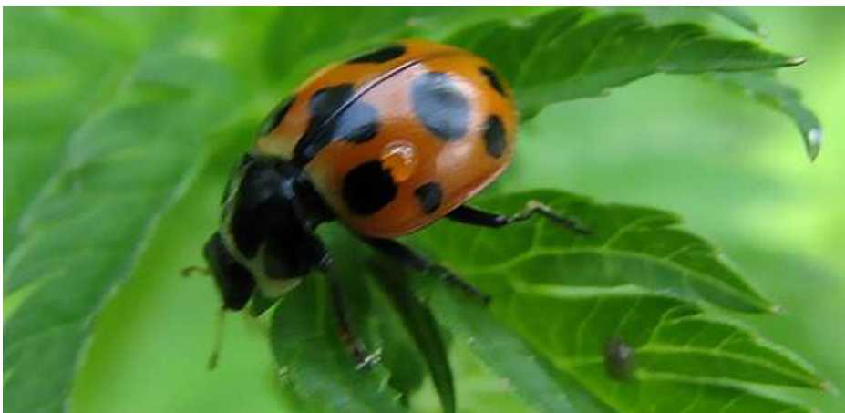
Abb. 7: Hippodamia notata

Diesen 11-14 mm große Weichkäferart findet man an Waldrändern, auf Waldwiesen und in Flussauen. Ancistronycha cyanipennis bevorzugt montane Gebiete und ist deshalb eher ein Kältezeiger. In Bayern ist die Art z.B. im Allgäu nicht selten, wohl aber im mittelschwäbischen Raum. Sie gilt als nicht gefährdet.