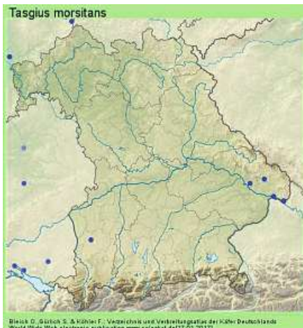
Abb. 6: Verbreitung von Tasgius morsitans www.coleokat.de/de/fhl/ 15.10.17

In Bayern ist die Art im Süden sehr selten. Für Schwaben stellt der Fund in Horgauergreuth den ersten bekannten Nachweis dar! In der Roten Liste Bayerns wird die Art als gefährdet aufgeführt.