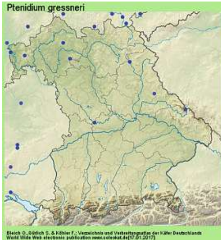
Abb. 5. Verbreitung von Ptenidium gressneri www.coleokat.de/de/fhl/ 15.10.17