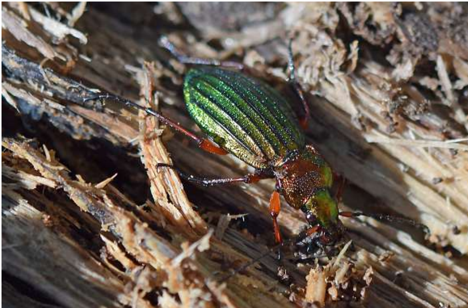
Abb. 4: Carabus auronitens

Der 3 cm große Goldglänzende Laufkäfer Carabus auronitens ist eine typische Waldart, die tendenziell kühlere und feuchte Wälder bevorzugt. Der Käfer lebt gerne an Totholz und jagt nachts Schnecken, Würmer und Kleininsekten. Die Art ist in Bayern weit verbreitet. Da aber mehr als 1/10 der Weltpopulation in Deutschland vorkommt, haben wir eine hohe Verantwortlichkeit für den Erhalt der Art.