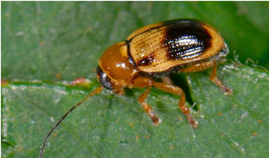
Abb. 8: Cryptophagus pusillus

Die Art wurde zwar knapp außerhalb Schwabens schon entdeckt, aber für Schwaben ist der Horgauergreuther Feuchtwald der erste Fund seit Kittels Nachweis aus dem Jahr 1881 bei Augsburg.