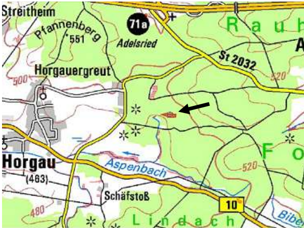
Abb. 1: Pfeil zeigt die Lage des Untersuchungsgebietes.

Im Waldgebiet Rauher Forst, das im Naturpark „Augsburg – Westliche Wälder“ liegt, findet sich inmitten von Fichtenbeständen ein kleiner Erlenwald, der von zahlreichen Quellbächen durchzogen ist. Das Untersuchungsgebiet liegt zwischen der Autobahn A8 und der Bundesstrasse B 10, etwa 2 km südlich der Autobahnausfahrt Adelsried. Direkt nördlich des Gebietes führt der Radweg auf der ehemaligen Bahntrasse Augsburg – Welden vorbei.