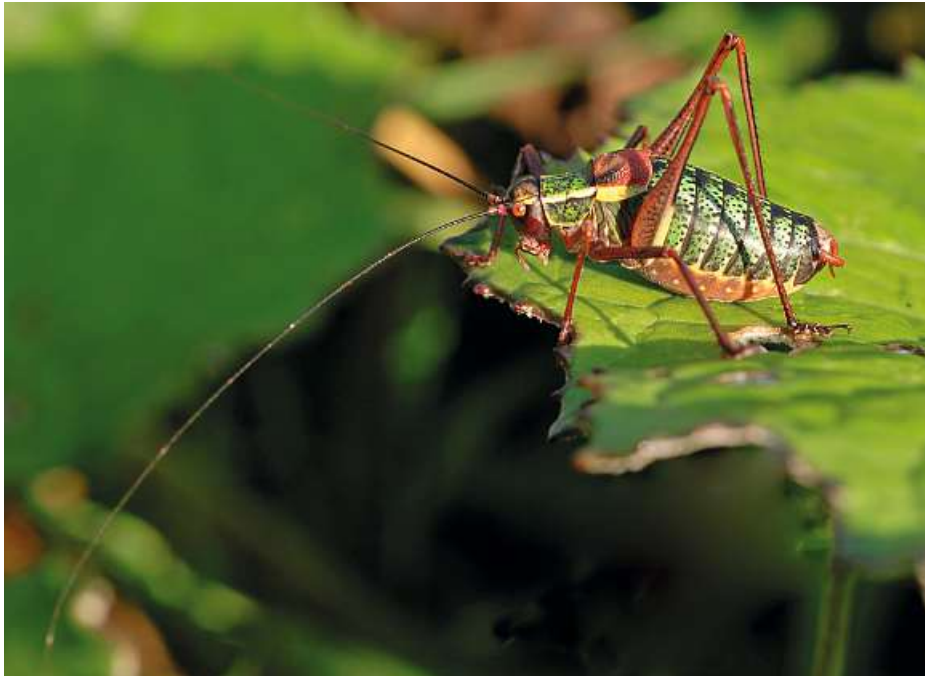
Abb. 9: Männchen von Barbitistes serricauda

Mit der Laubholz-Säbelschrecke ( Barbitistes serricauda ) wurde eine wohl weiter verbreitete, aber nur selten nachgewiesene Bewohnerin der Baumkronen gefunden. In Bayern ist die Art vor allem im montanen Bereich mit Schwerpunkt Südbayern vertreten. In den Westlichen Wäldern ist die Art verbreitet.