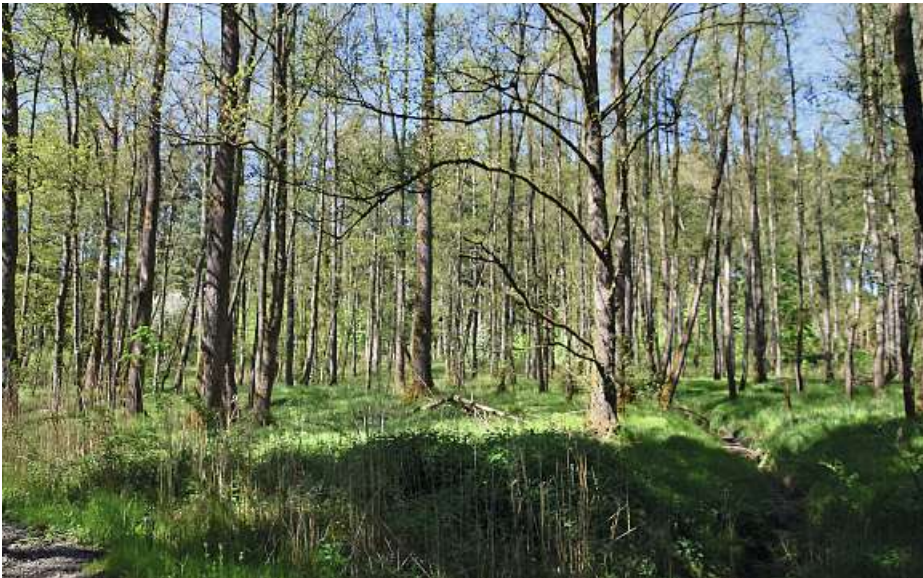
Abb. 3: Untersuchungsgebiet am 8.5.2016