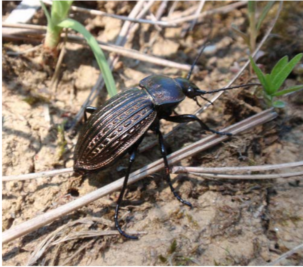
Abb. 4: Höckerstreifen-Laufkäfer ( Carabus ullrichii )