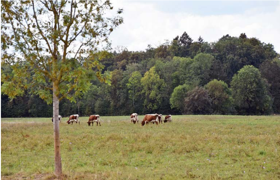
Abb. 7: Ausgleichsfläche Bannacker mit Pinzgauer Rindern

Die Untersuchung der Käfer- und Wanzenfauna dieser Ausgleichsfläche zeigt, dass selbst in intensiv genutzter Agrarumgebung bei ausreichend großer Fläche und entsprechend extensiver Bewirtschaftung durchaus artenreiche Lebensräume entstehen und überleben können. Die Untersuchung, die aufgrund der einsetzenden Beweidung nur unvollständig durchgeführt werden konnte, zeigt eine beeindruckende Artenzahl. Viele Arten des extensiven Grünlandes, das früher die Wertachauen prägte, konnten hier noch überleben. Bereits jetzt zeigt sich, dass die Ausgleichsfläche Bannacker ein wichtiges Refugium für Arten des mageren Grünlandes in weitgehend ausgeräumter Agrarlandschaft darstellt.