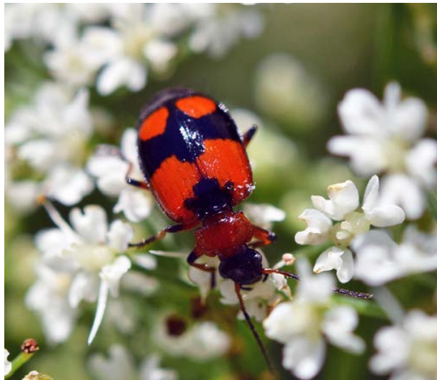
Abb. 5: Schwarzbindiger Prunkläufer ( Lebia cruxminor )