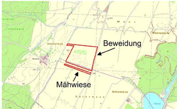
Abb. 2: Umgriff der untersuchten Ausgleichsflächen