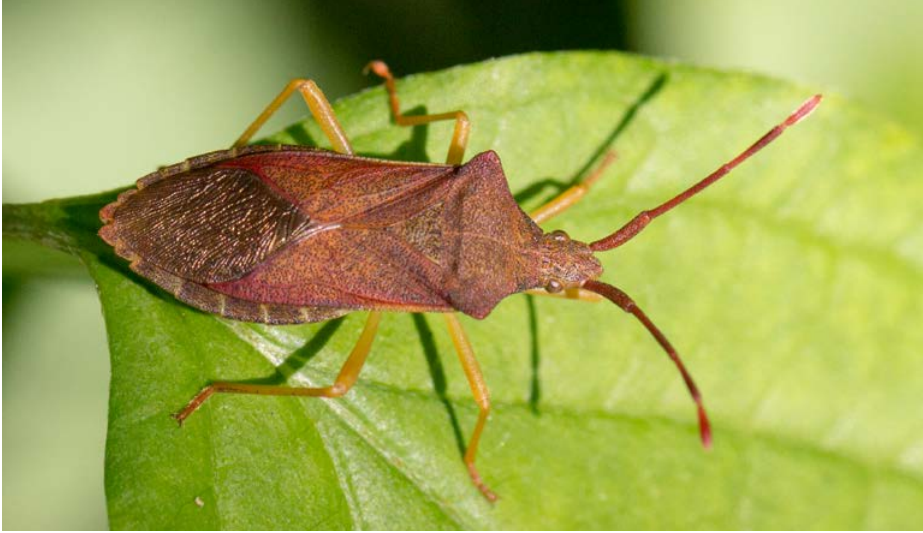
Abb. 6: Braune Randwanze ( Gonocerus acuteangulus )

Tab. 2: Liste der 2018 nachgewiesenen Wanzenarten