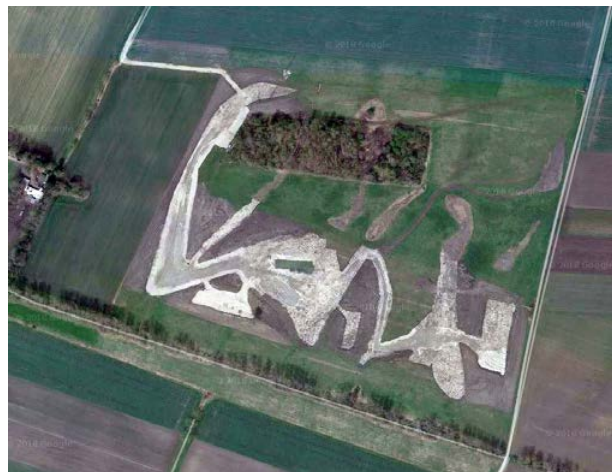
Abb. 3: Luftbild mit abgeschobenen Oberbodenflächen

2018 wurde der Oberboden in den ehemaligen Flutmulden abgeschoben und zur Modellierung des Geländes verwendet. Anschließend wurde mit der Beweidung mit Pinzgauer Rindern begonnen.