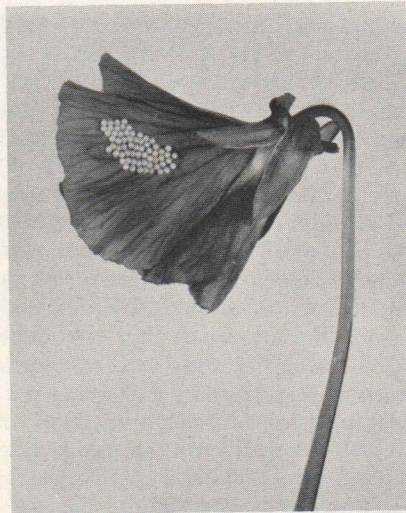
Eigelege von Spilosoma luteum Hufn. an einer Stiefmütterchenblüte (Natürliche Größe)