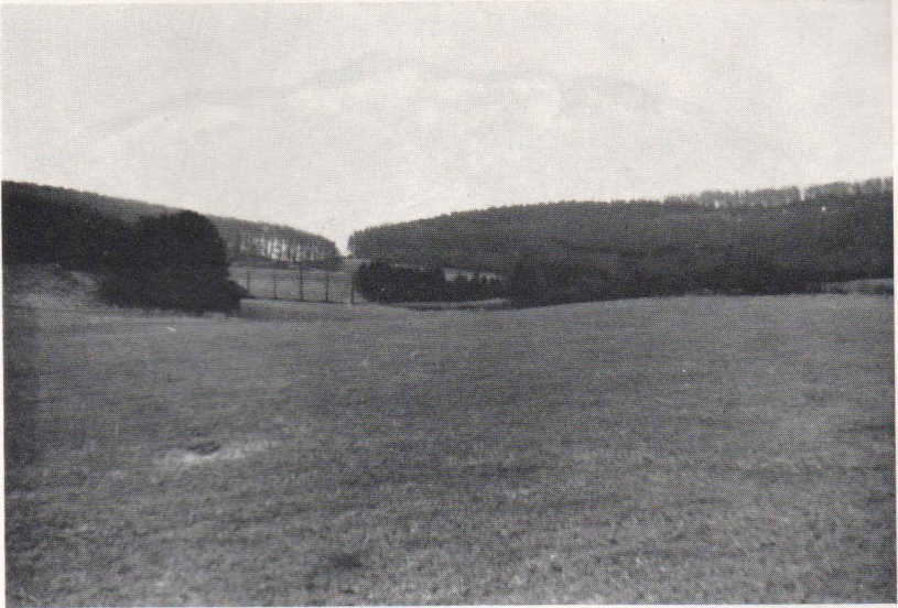
Abb. 2 Blick in die Karstmulde von Nordwesten