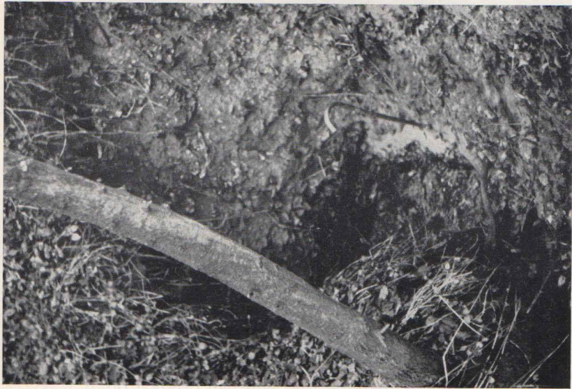
Abb. 3 Ponor am Abschluß des Kerbtales II