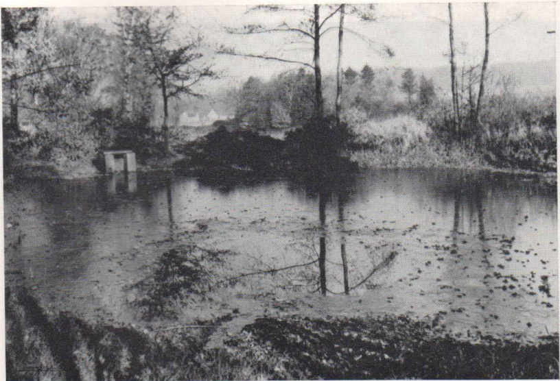
Abb. 4 Teich mit Überlaufschicht (Kerbtal I)