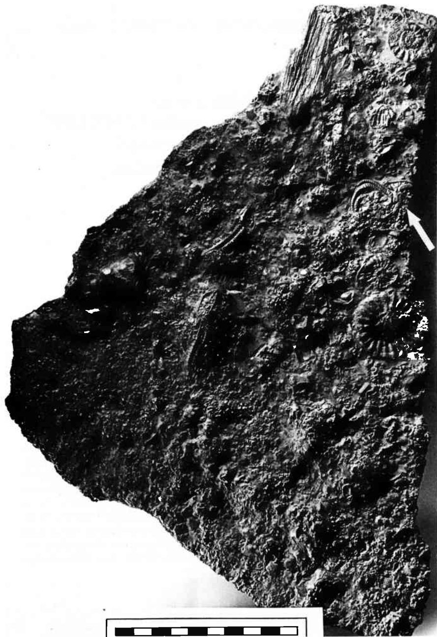
Abb. 1: Fossilplatte mit einem Schlangensterne ( Palaeocoma sp., durch einen Pfeil bezeichnet). Lias \gamma_3 , ehemalige Ziegeleitongrube der Firma TÖPKER, Bielefeld-Altenhagen. Aufbewahrung: Naturkundemuseum Bielefeld. Leg. et ded. H. STACHE, Detmold. Knapp 1/2X.