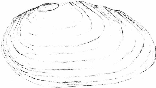
Abb. 2: Anodonta anatina aus dem gleichen Gewässer