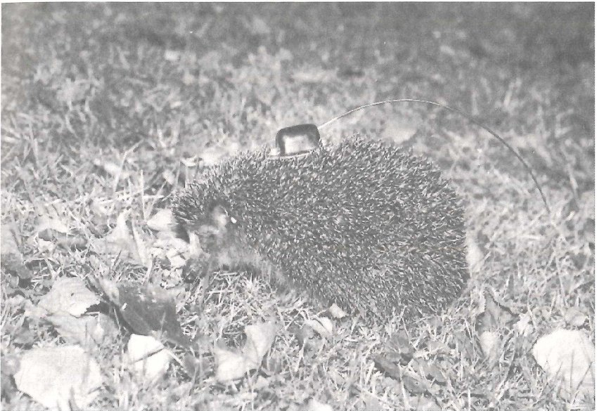
Abb. 2: Igel mit Sender

Um die Gewichtsentwicklung und die Aktivität der Tiere genau verfolgen zu können wurden einzelne Individuen mit speziell für Igel entwickelten Sendern versehen, die eine Reichweite von ca. 500-600 m hatten.