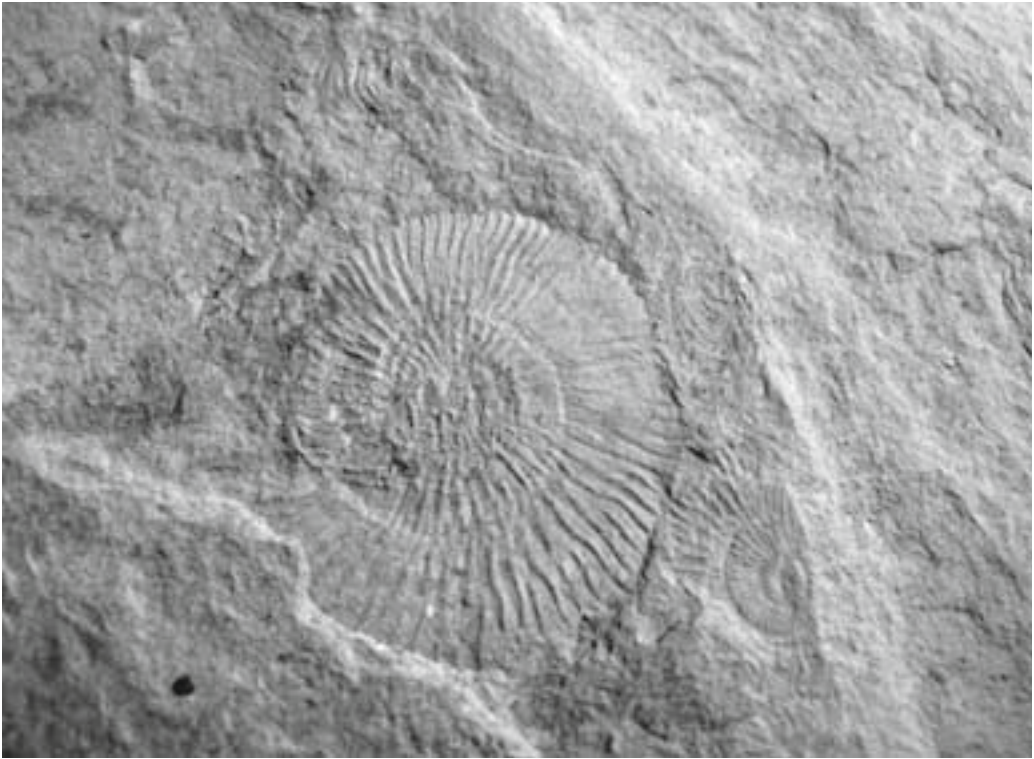
Abb. 3 : Ammonit Dactylioceras semiannulatum (SOWERBY), Durchmesser 5,5 cm auf Posidonien-schieferplatte.

einzelnen Anreicherungen sind nach Größe der Objekte sortiert und es sind beispielsweise Zähne mit wenigen Millimetern bis zu einer Länge von 2,5 cm in den jeweiligen Ablagerungslinsen zu finden. Auch die Knochenreste sind sortiert abgelagert worden. Alle Fossilien weisen starke Spuren von Abrollung auf und es findet sich kaum ein Zahn in seinem Originalzustand. Diese Ablagerungslinsen können Größen bis zu 2 m im Durchmesser und eine Stärke von bis zu 15 cm erreichen. Als weitere Besonderheit ist noch ein an der südlichen Grubenkante anstehendes Fragment aus dem unteren Lias zu nennen. Hier war der Grenzbereich vom Keuper zum Lias mit Hartsteinbänken der planorbis -Subzone aufgeschlossen. In einer oberen nicht horizontbeständigen Hartsteinbank fanden sich Pylonoceras