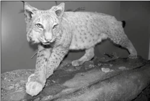
Abb. 5: Luchs „Volker“, präpariert von Carsten Grobek und bereit, in die Dauerausstellung einzuziehen.

- Luchs „Volker“. Das Tier starb 2013 im Tierpark Olderdissen in Bielefeld. Mit Hilfe von Spendengeldern konnte die Präparation des Luchses durch Carsten Grobek (Auetal) in Auftrag gegeben werden. Die stattliche Raubkatze (Abb. 5) wird demnächst in der Dauerausstellung "ausSterben - überLeben" zu sehen sein.