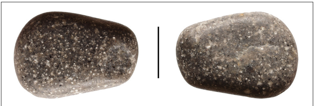
Abb. 3: Gastrolith des Kronsmoorer Elasmosauriers in der Sammlung von Joachim Ladwig. Der Maßstab entspricht 2 cm.

Zwei Blöcke enthalten die Reste von fünf Wirbelcentra (Abb. 4a, b), die aber größtenteils beschädigt sind. Das besser erhaltene Centrum besitzt eine quadratische Form und hat eine Länge von 105 mm. Die Artikulationsflächen sind, soweit dies erkennbar ist, nur schwach konkav. Die Größe und Form der Wirbel korrespondiert mit den von MAISCH & SPAETH (2004) beschriebenen posterioren Cervicalwirbeln und Thoracalwirbeln (= Pectoral- oder anterioren Dorsalwirbeln) des Exemplars.