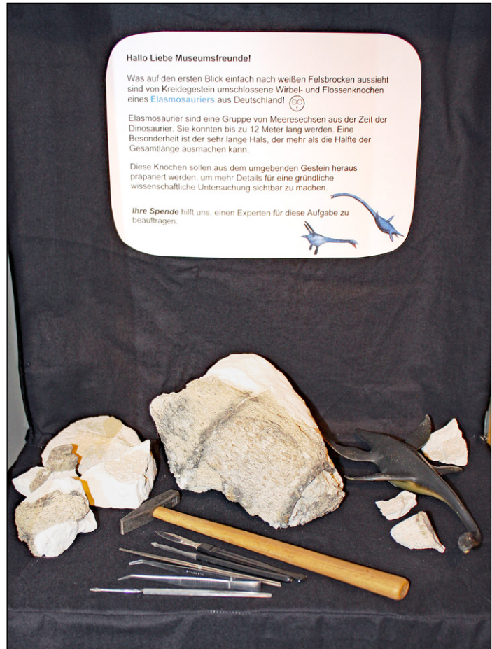
Abb. 1: Ausstellung der Exponate im Eingangsbereich des Naturkunde-Museums im Sommer 2016, um Spenden für die Präparation zu sammeln.

et al. 2017b) sowie ein Dorsalwirbel aus dem oberen Unterampanium oder unteren Oberampanium von Wismar in Mecklenburg-Vorpommern, der jedoch ein Geschiebefund ist und seinen Ursprung vermutlich im Gebiet des heutigen Südschwedens hat (FOTH et al., 2011). Der bisher vollständigste Fund dieser Gruppe aus der Oberkreide Deutschlands ist ein Skelett aus dem Oberampanium von Kronsmoor in Schleswig-Holstein, zu dem auch die hier beschriebenen Reste gehören. Diese hat der Zweitautor, Joachim Ladwig, dankenswerter Weise im Sommer 2016 dem Naturkunde-Museum Bielefeld übergeben. Zu diesem Zeitpunkt waren die Stücke noch