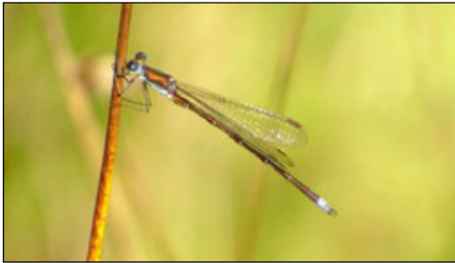
Abb. 3: Lestes virens vestalis (Kleine Binsenjungfer)

Die Emergenzperiode erstreckt sich von Anfang Juni bis Ende August (MENKE, GÖCKING et al. 2016). An den Fundgewässern wurde sie Anfang bis Mitte August nachgewiesen.