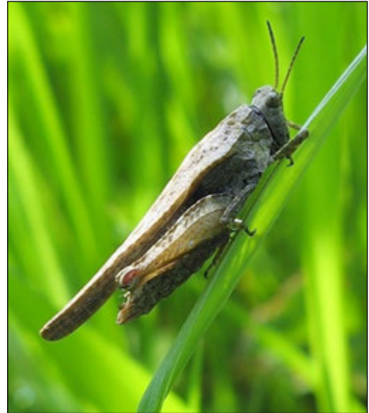
Abb. 15: Tetrix subulata (Säbeldornschröcke)

geregelt wird. 2002 kamen diese Rohbodenflächen noch reichlich durch die damals jüngst abgeschlossenen Bautätigkeiten vor. Heute gibt es diese wichtigen Flächen nur noch in geringem Maße verursacht durch Trittschäden des Weideviehs.