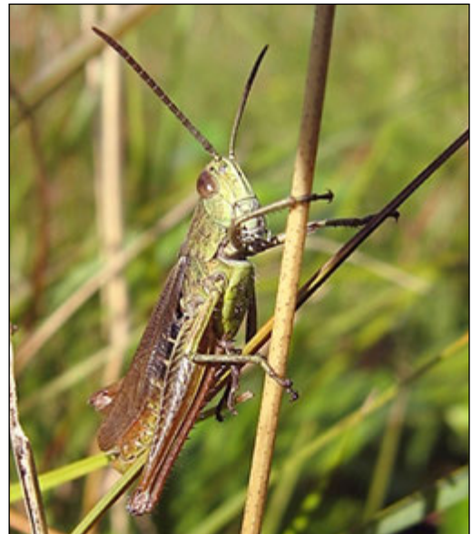
Abb. 17: Chorthippus dorsatus (Wiesengrashüpfer)

Der Wiesengrashüpfer kommt auf allen Wiesen und Weiden der untersuchten Bauabschnitte regelmäßig und teils mit einer hohen Individuenanzahl vor. Er fehlt nur in den beschatteten Randbereichen, den schattigeren Sukzessionsbereichen, den Hochstaudenflu-