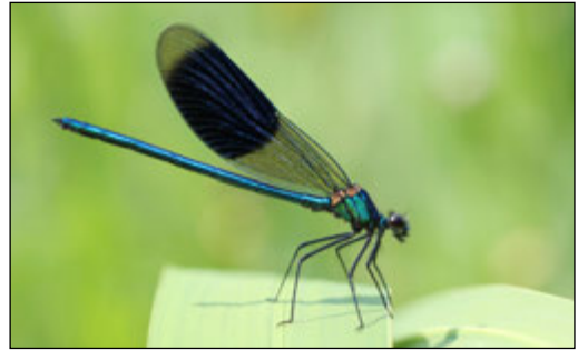
Abb. 2: Calopteryx splendens (Gebänderte Prachtlibelle)

L. dryas wird in Deutschland als „gefährdet“ und in NRW als „stark gefährdet“ eingestuft (CONZE & GRÖNHAGEN 2011).