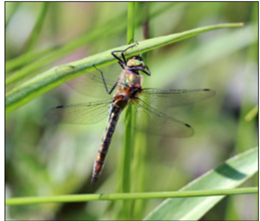
Abb. 9: Cordulia aenea (Gemeine Smaragdlibelle)

Cordulia aenea (Gemeine Smaragdlibelle) konnte nur in Bauabschnitt 6 Mitte an zwei Teichen festgestellt werden. Sie ist in NRW eine mäßig häufige Art, die die verschiedensten Stillgewässer besiedelt. Offensichtlich bevorzugt sie Gewässer, welche mit Gehölzen umsäumte Ufer aufweisen oder sich in Waldnähe befinden (MENKE, GÖCKING et al. 2016). Dieses trifft auf die Fundgewässer im Untersuchungsgebiet zu.