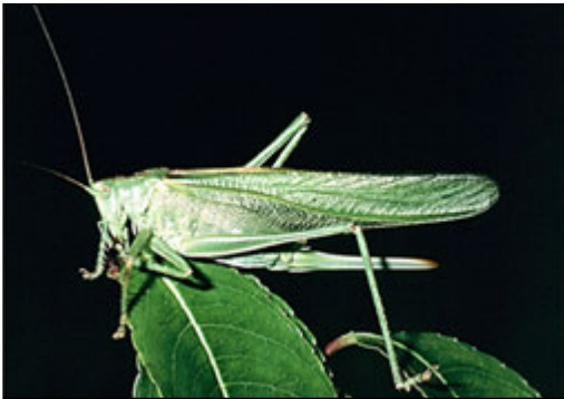
Abb. 13: Tettigonia viridissima (Grünes Heupferd)

anzutreffen. Sie meidet lediglich extrem trockene und nasse Biotoptypen. Die Eiablage erfolgt in markhaltige Pflanzenstängel. ( www.natur-in-nrw.de Zugriff: 03.12.2017). Bei der Untersuchung 2002 wurde die Art nur in Bauabschnitten 5 festgestellt. Durch die Untersuchung 2016 und 2017 wurde die Art in den Bauabschnitten 1, 6, 4 erstmalig festgestellt. Hier kommt sie auf allen Untersuchungsflächen mit einer hohen Stetigkeit vor.