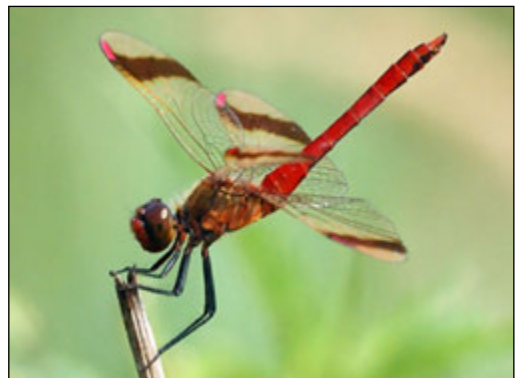
Abb. 8: Sympetrum pedemontanum (Gebänderte Heidelibelle)

Für die Art wird diskutiert, ob sich eine extensive Beweidung als günstig erweisen könnte (NVL.2002 in MENKE, GÖCKING et al. 2016). In den Untersuchungsgebieten gibt es zahlreiche stehende Gewässer in Rinderweiden und fließende Gewässer am Rande der Weiden. An Untersuchungsgewässern in Weidegrünland wurde diese Art, im Gegensatz zu vielen anderen seltenen Arten (s. o.), allerdings nicht nachgewiesen.