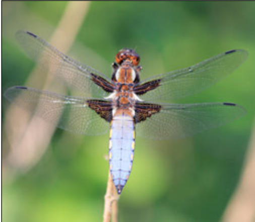
Abb. 10: Libellula depressa (Plattbauch, Männchen)