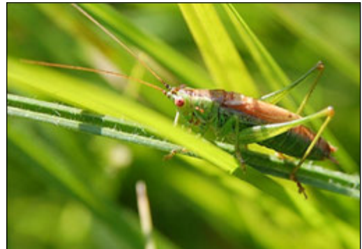
Abb. 12: Conocephalus dorsalis (Kurzflügelige Schwertschrecke)

Die Kurzflügelige Schwertschrecke wurde in allen drei Bauabschnitten nachgewiesen. In Bauabschnitt 4 konnte sie mit mittlerer Häufigkeit in den höherwüchsigen Seggenbeständen, in den von Rindern weniger intensiv beweideten Bereichen und in den besonnten Hochstaudensäumen um die Stillgewässer festgestellt werden. In den Bauabschnitten 1 und 6 besiedelte die Art ähnliche Biotopstrukturen, kam aber mit Ausnahme der feuchten Hochstaudenflur im Norden des Bauabschnittes 1, nur in geringer Individuenanzahl vor. Entscheidend für ihr stetiges und häufiges Vorkommen ist eine ausreichende Besonnung des Standortes. Feuchte besonnte Hochstaudenfluren kommen im Untersuchungsgebiet nur an den Kleingewässern in Weiden oder in Senken inmitten feuchter Wiesen vor.