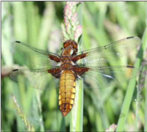
Abb. 11: Libellula depressa (Plattbauch, Weibchen)