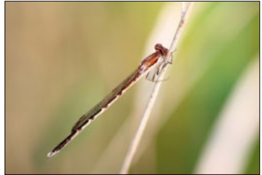
Abb. 4: Sympecma fusca (Gemeine Winterlibelle)

Sympecma fusca (Gemeinde Winterlibelle) ist eine in NRW nur mäßig häufige Art (MENKE, GÖCKING et al. 2016) welche überwiegend an Stillgewässern vorkommt. Sie ist die einzige bei uns einheimische Libelle, welche als Imago überwintert. Die Untersuchung 2001 an der Großen Aue erbrachte keinen Nachweis. 2015 wurde sie an sechs Probestellen nur im Bauabschnitt 6 nachgewiesen. Im Bauabschnitt 6 Süd wurde an mehreren Untersuchungs-gewässern ein Bodenständigkeitsnachweis erbracht. Es ist möglich, dass die Art an weiteren Gewässern vorkommt aber bei der Untersuchung nicht erfasst werden konnte, da die Art nur bis Mai anzutreffen ist. Gefährdet wird die Art durch Eutrophierung und Beschattung der Fortpflanzungsgewässer.