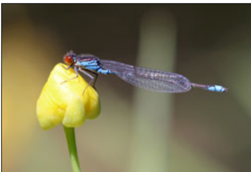
Abb. 6: Erythromma viridulum (Kleines Granatauge)

Untersuchungen zur Entwicklung der Wasservegetation wurden seit 2002 im FFH-Gebiet Große Aue nicht wieder durchgeführt, sind aber auch in Bezug auf die Entwicklung der Fischfauna und der Libellen unerlässlich.