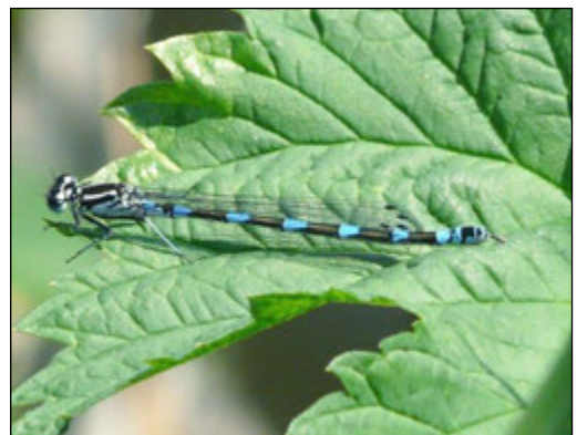
Abb. 5: Coenagrion pulchellum (Fledermaus-Azurjungfer)

Im Untersuchungsgebiet wurde sie mit einer Stetigkeit von 41 % nachgewiesen. In Bauabschnitt 6 konnte mehrfach ein Bodenständigkeitsnachweis erbracht werden. Sie kam dort überwiegend an Gewässern mit vielfältiger, gut ausgebildeter Ufervegetation vor.