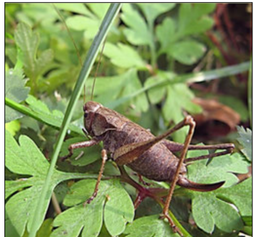
Abb. 14: Pholidoptera griseoptera (Gewöhnliche Strauchschrecke)

In den Untersuchungsabschnitten wurde sie, wie es typisch für die Art ist, in den beschatteten Randbereichen angetroffen.