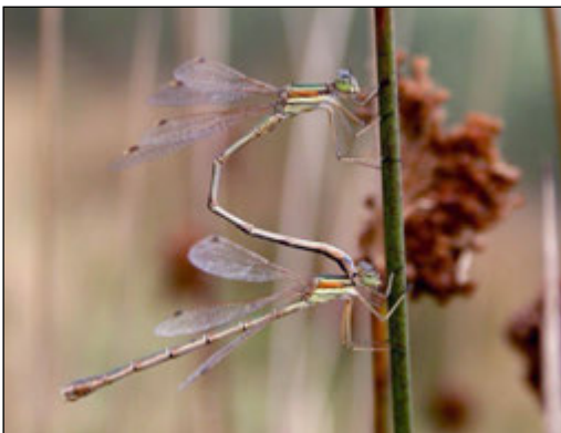
Abb. 1: Lestes barbarus (Südliche Binsenjungfer)

Ebenso konnte an diesen charakteristischen Untersuchungsstellen im Bauabschnitt 1 Lestes dryas (Glänzende Binsenjungfer) mit mehreren Individuen und Bodenständigkeitsnachweis festgestellt werden. Lestes dryas wurde zusätzlich noch im Verlandungsbereich des Teiches 4 im Bauabschnitt 1 angetroffen. Diese Art wurde nur im Bauabschnitt 1 nachgewiesen.