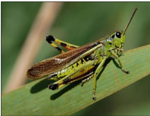
Abb. 16: Stethophyma grossum (Sumpfschrecke)

Sie konnte in allen drei Bauabschnitten nachgewiesen werden. Hier besiedelt sie bevorzugt die nasse höhere Vegetation im Umfeld der Kleingewässer und die feuchten bis nassen Bereiche in den Wiesen und Weiden. In höherer Individuenanzahl kam sie in den einmal jährlich gemähten, hochstaudenreichen Wiesen des Bauabschnitts 1 vor. Bei der Untersuchung 2002 wurde sie in Bauabschnitt 4 nicht nachgewiesen.