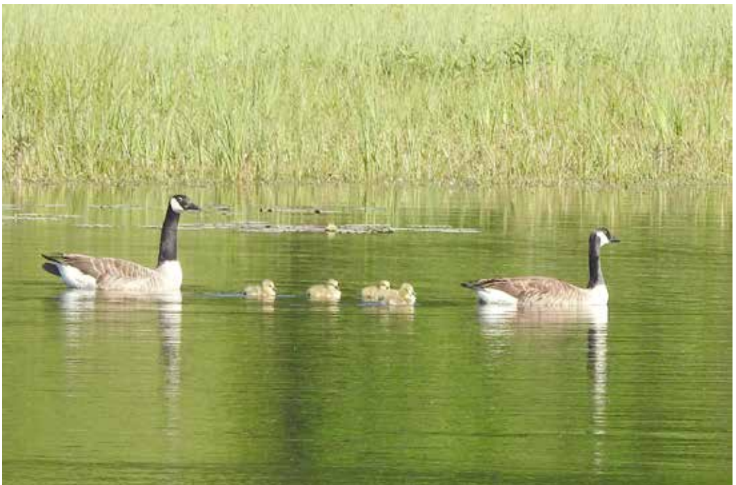
Abb. 3: Kanadagansfamilie, die einzige 2020 am Schnakenpohl brütende Wasservogelart.