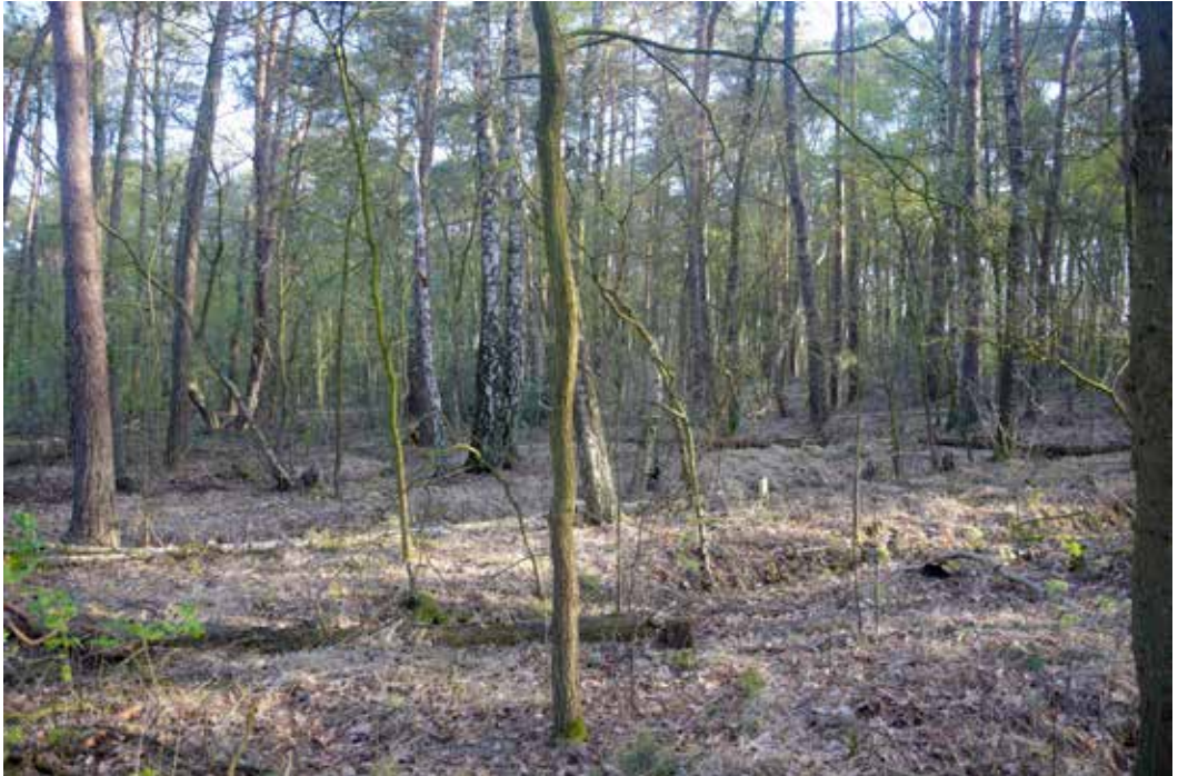
Abb. 2: Unterholzreicher Wald im April 2020 im Norden des NSG.