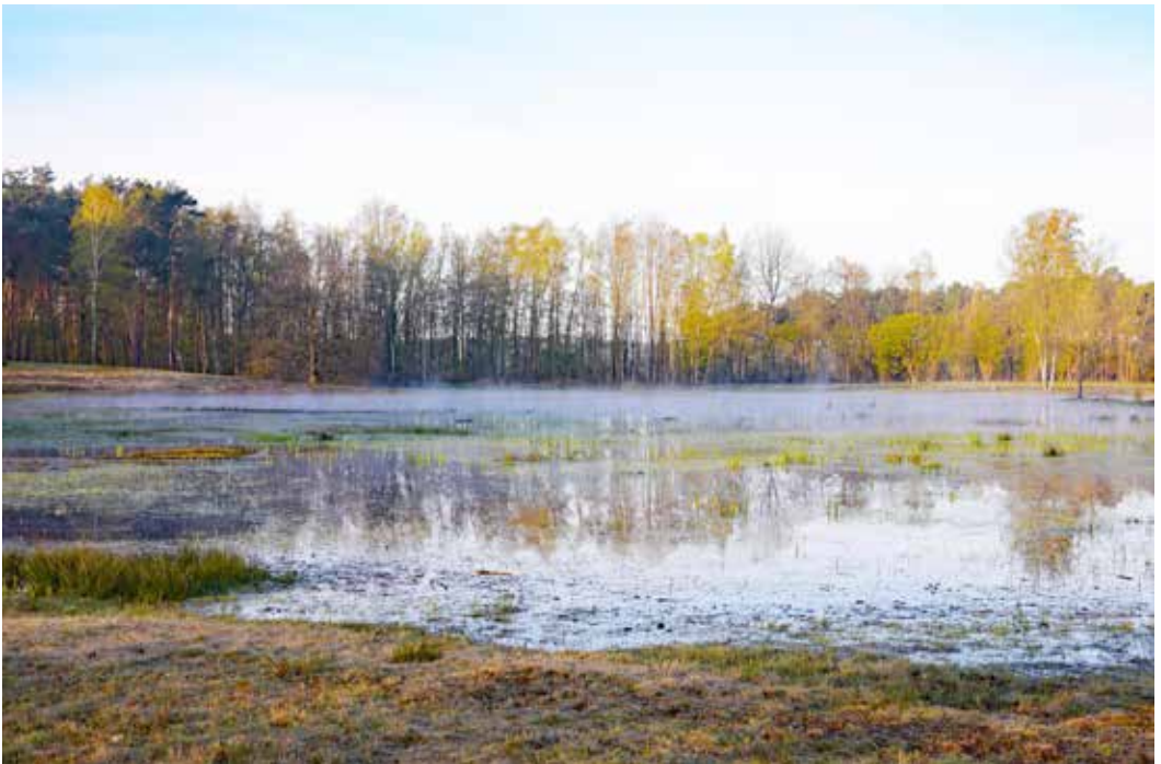
Abb. 1: Blick auf den Heideweier im März 2020 nach Süden. Im linken und vorderen Bildteil: Überschwemmte Feuchtheide.