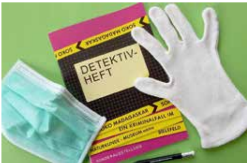
Exklusive Ermittler-Ausrüstung –konform mit den geltenden Hygieneregeln

Komplexe Sachverhalte zu Seltenen Erden vermittelten sich im Laufe der Ermittlungen ganz von selbst: wo sie vorkommen, wie aufwendig ihre Gewinnung ist und welche Probleme der Rohstoffhunger des High-Tech-Zeitalters für Umwelt und Gesellschaft in den Herkunftsländern mit sich bringt.