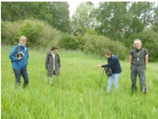
Teilnehmer/-innen der Exkursion am 28. Juni 2020 im NSG Satzer Moor.