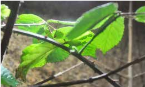
Gut getarnt: das Wandelnde Blatt ( Phyllium giganteum )

Termine für Gruppen waren bereits vergeben und mussten abgesagt werden. Von nun an entführten virtuelle Führungen in die Welt der Gliederfüßer. Diese wurden auch zahlreich angenommen, konnten aber nur einen schwachen Ersatz für den direkten Kontakt mit den Krabbeltieren bieten.