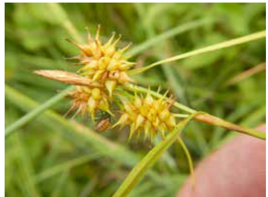
Gelb-Segge ( Carex flava ) mit Wanzen-Nymphe bei Brakel.