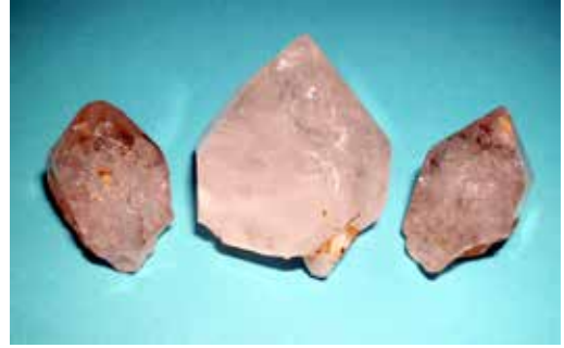
Quarz XX vom SW-Hang Limberg b. Preuß. Oldendorf