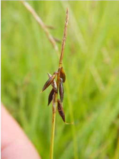
Floh-Segge ( Carex pulicaris ) im NSG Satzer Moor.

Dann ging es zu einem Kalkhalbtrockenrasen westlich Brakel-Riesel. Neben einem sehr ansehnlichen Vorkommen der Mücken-Händelwurz ( G. conopsea ) und der Stängellosen Kratzdistel ( Cirsium acaule ) wurde u. a. auch das Gewöhnliche Katzenpfötchen ( Antennaria dioica ) beobachtet, am Ackerrand die Kleine Wolfsmilch ( Euphorbia exigua ); die Brotzeit