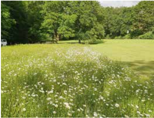
Mit Regioaatgut eingesäte Fläche im Heeper Grünzug.