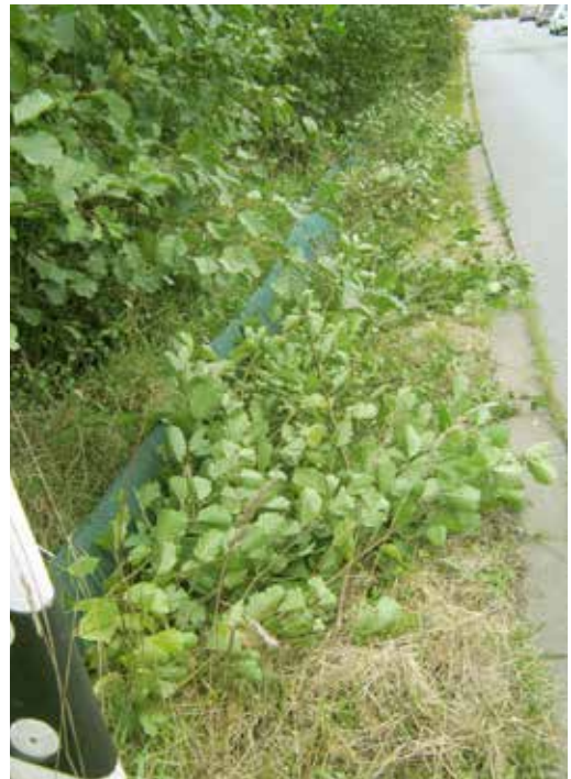
Amphibienbetreuer schnitten die Jungpappeln die über Schutzzaun bis über das Bankett ragten.

An der Bechterdisser Straße wurden von Amphibienbetreuern außer dem Krautschnitt hinter den Zäunen ständig massenhaft zwei Meter hohe Jungpappel bzw. deren Austriebe abgeschnitten, die vor, wie hinter den Schutzzäunen dicht und bis in den Straßenraum ragten.