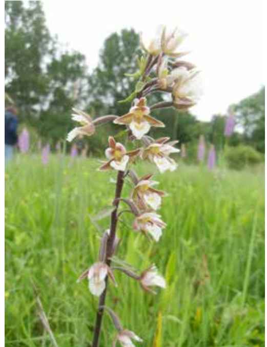
Sumpf-Stendelwurz ( Epipactis palustris ) bei Brakel.