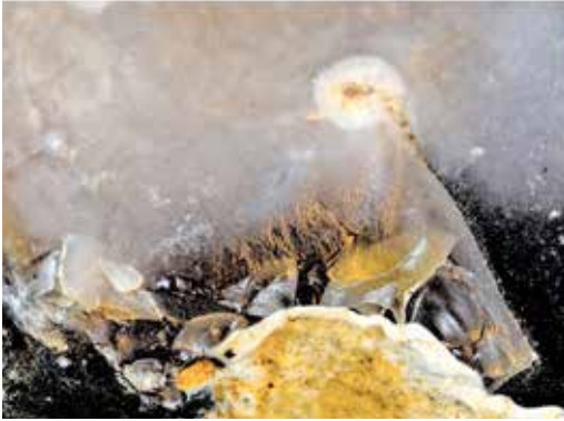
Ein Mädchen.