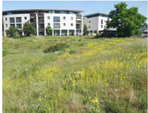
Grünfläche in Sennestadt, die einmal eingesät wurde, inzwischen aber auch viele weitere eingewanderte Pflanzenarten erhält, auch hier wurde über eine ökologische Pflege mit allen Beteiligten diskutiert.