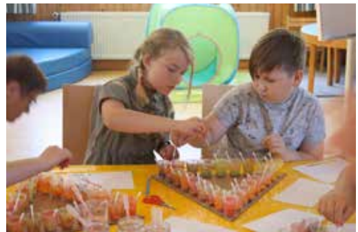
Farbmischer*innen bei der Arbeit

Das Jahr begann mit den vielfältigen, bewährten und neuen Programmen für Schulen, Kitas und offenen Angeboten. Die Pandemie und die daraus resultierenden Schließungen bedeuteten auch hier herbe Einschnitte, vor allem auch für unsere freiberuflich Mitarbeitenden. Ab Juni gingen die Programme eingeschränkt und mit strengen Hygienekonzepten weiter, um zum Ende des Jahres wieder ausgesetzt werden zu müssen.