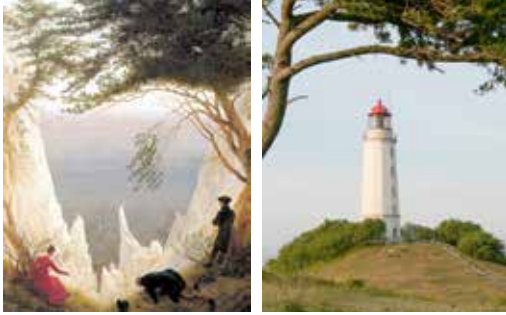
Links: Caspar David Friedrich. Rechts: Hiddensee: Dornbusch