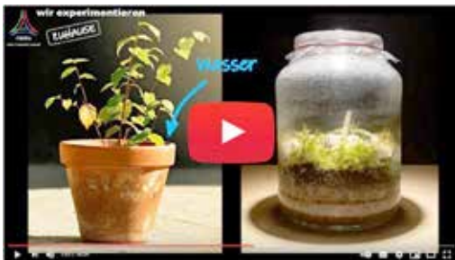
Eine Welt im Glas, die „ewig lebt“ (Screenshot)

Zu acht Gliederfüßer-Videoclips gibt es begleitende Arbeitsmaterialien für den Einsatz im Biologieunterricht. Erarbeitet wurden diese von Studierenden der Biologiedidaktik (Zoologie und Humanbiologie) der Universität Bielefeld. Sie können kostenlos unter https://namu-ev.de/bildungsangebote/downloads heruntergeladen werden.