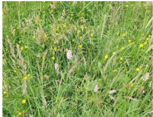
Grünfläche am „Monte Scherbelino“ in Heepen, diese wurde bislang gemulcht, soll u. a. wegen des Fundes vom Wiesen-Knöterich bei der Befahrung künftig 2x im Jahr gemäht werden.

Vereines, darunter auch unsere Jahrestagung, endgültig abgesagt werden mussten und auch die Volkssternwarte Ubbedissen öffnete ihre Tore im Jahr 2020 nicht mehr.