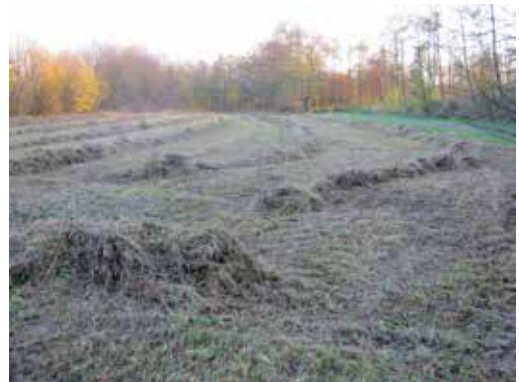
Nach Jahren ein Erfolg: die Wiese wurde gemäht, später das Heu abgefahren.

Die Wiese, Wanderkorridor wie Lebensraum an der Bechterdisser Straße, wurde dieses Jahr im November erfreulicherweise nicht mehr tief gemäht, geschreddert und gemulcht, son-