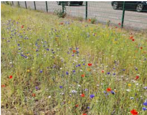
Derartige Einsaaten wird es künftig nicht mehr geben, auch solche Flächen, hier an der Johanneswerkstraße, wurden beim Abfahren mit dem Umweltbetrieb besichtigt und diskutiert.