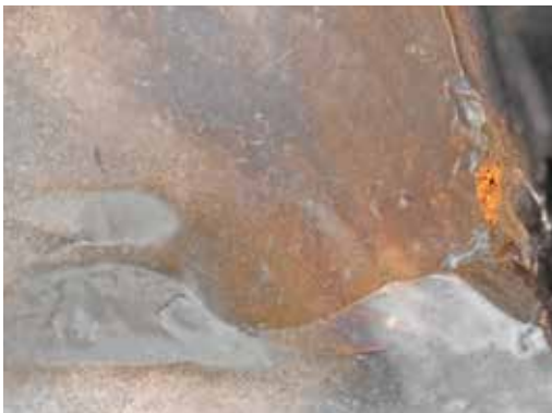
Vulkaneruption auf einer einsamen Insel.