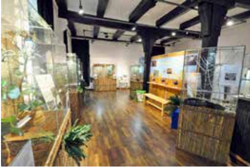
Blick in die Ausstellung „Pioniere des Tierreichs“

Termine für Gruppen waren bereits vergeben und mussten abgesagt werden. Von nun an entführten virtuelle Führungen in die Welt der Gliederfüßer. Diese wurden auch zahlreich angenommen, konnten aber nur einen schwachen Ersatz für den direkten Kontakt mit den Krabbeltieren bieten.