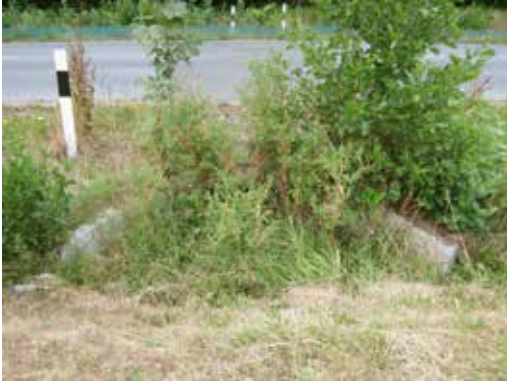
Kleintiertunnel Anfang August 2019 zugewachsen

anderen Pflegearbeiten während der fast ganzjährigen Schutzmaßnahmen bereits überfordert und haben das Mähen der Tunnelleingangsbereiche nicht mehr ausgeführt, auch weil sie dafür nicht zuständig sind. Dieses Jahr fand die AG glücklicherweise eine Person, die vier Tunnelleingangsbereiche freigeschnitten hat.