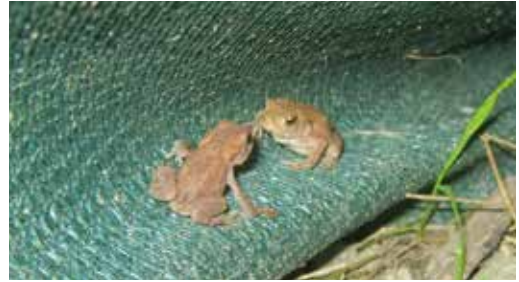
Diesjährige Erdkröten auf Zaunfalte

9. Juli, exakt die Hälfte der notierten Amphibien wurden nicht an den Schutzzäunen, sondern auf Straße, Spazierweg, Einfahrt aufgelesen, zu 95 % lebend!