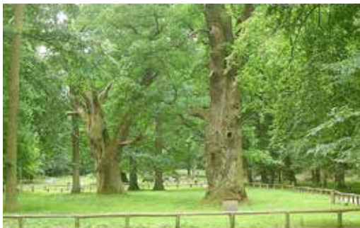
Im Ivenacker Forst

Bereits die Hinfahrt führt uns zu den ersten Höhepunkten der Reise. Im Naturpark Mecklenburgische Schweiz besuchen wir im Ivenacker Forst eine einmalige naturhistorische Besonderheit: die mächtigsten Eichen Europas mit einem Alter bis zu ca. 1.000 Jahren. Die Bäume haben Stammumfänge von