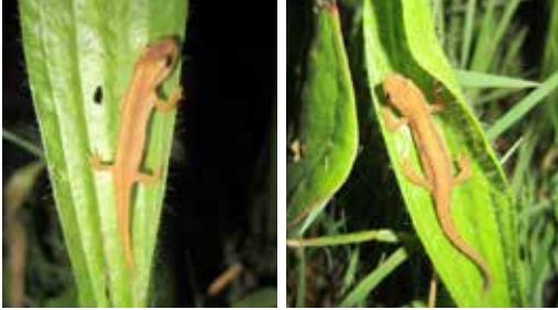
Junger Teichmolch, ca. 3 cm auf Spitzwegerich am Zaun