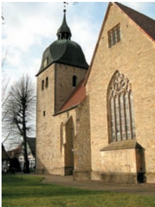
Kirche St.Johann in Melle-Riemsloh, Turmbau im Jahre 1462, Chor 1507.

Der Grundbesitz der Werburger Bauherren im Verbreitungsgebiet des Meller Schilfsandsteins lässt sich in den verschiedenen Zeiten der Bautätigkeiten nicht eindeutig nachweisen. Nach A. WEHRENBRECHT (1994) wird jedoch deutlich, dass die Werburger Herren über Besitzungen oder Zugriffsmöglichkeiten jenseits der heutigen Landesgrenze verfügten, welche damals für das Wirtschaftsleben nicht so ausgeprägt war.