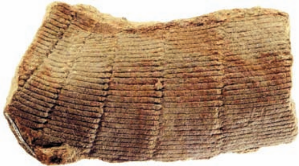
oben: Schachtelhalm-Stängel, Equisetites arenaceus Länge: 16 mm, Fund aus der Herforder Region, Sammlung Wilhelm Normann, Verwahrt: Naturkunde-Museum Bielefeld, Beleg-Nr.: ES/km-1962