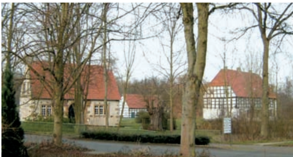
Werburg in Spenge, links im Vordergrund das Torhaus, rechts das Herrenhaus, zwischen beiden die Scheune. Aufnahme: 4. Januar 2008

die archäologischen Grabungen des Westfälischen Amtes für Bodendenkmalpflege in den Jahren 1995, 1999, 2004 und 2005, in denen reichhaltiges Mauerwerk z.T. auch aus wesentlich früheren Zeiten vor 1596 freigelegt worden war. Nach Sichtung des umfangreichen Baumaterials verschiedenartiger Gesteinsarten soll hier ein Sandstein des Keupers, nämlich Schilfsandstein aus dem mittleren Keuper, beschrieben werden, der für die Bauwerke des Raumes um Melle und Spenge recht typisch ist. Seine Zusammensetzung, Mineralogie und Geologie sowie Herkunft seiner Bestandteile und spezifische Eignung als Baumaterial werden erläutert.