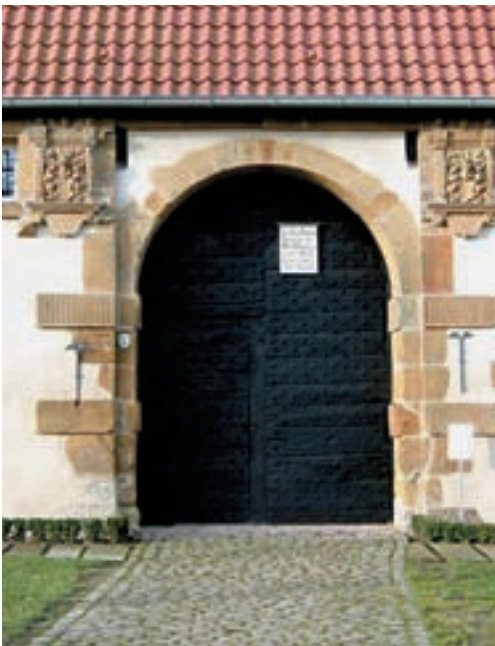
Ostportal des Werburger Torhauses, erbaut im Jahre 1596. Als Sichtmauerwerk wurde hauptsächlich der gelbbraune Osningsandstein (Unterkreide) verwendet.

Ein beliebtes Baumaterial für Sakral- und Profanbauten war in der Region um Spenge und Melle der Schilfsandstein, ein Schichtenglied des mittleren Keupers (Trias-Periode). Man nennt ihn hier den "Meller Stein". Vermögende Bauherren aus dem Klerus, Adel oder Besitzbürgertum konnten das Material in Steinbrüchen abbauen lassen, das gute Eigenschaften für Bauzwecke aufwies. Die Steinbrüche lagen z.T. in Gebieten eigenen Grundbesitzes, ihre Nähe garantierte kurze Transportwege und Vermeidung von möglichen Zolkkosten. Vorteile für die Bauwirtschaft waren Materialeigenschaften, wie geeignete Spaltbarkeit des Gesteins für die Gewinnung von Werksteingröße, Festigkeit für Belastungsdrucke, leichte Bearbeitbarkeit für die Steinmetze, Verwitterungsbeständigkeit. Das aus dem Sandstein gewonnene Baumaterial hat Jahrhunderte überdauern können.