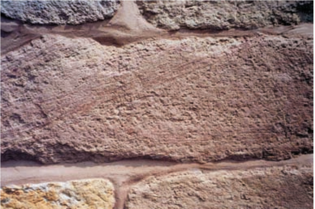
Schilfsandstein an der Herforder Münsterkirche

zu Mauer- und Werksteinen. Das rohe Mauerwerk der Werburg-Anlagen ist durch Verputz der Torhaus-Außenwände und Wiederverfüllung der im Jahre 2005 freigelegten Wehranlagen nicht mehr sichtbar. So ist zu loben, dass die Innenwände des Torhauses z.T. "mauersichtig" gestaltet wurden und hier ein sehr guter Überblick über das verwendete Baumaterial gegeben ist. Der Schilfsandstein erscheint – zwar gedunkelt durch ein Imprägnationsmittel – in seinen ebenmäßigen Bruchformen und seiner leicht olivgrün getönten Färbung.