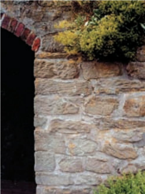
Mauer aus Schilfsandstein-Werksteinen an der Mühle von Westhoyel/Stadt Melle, erbaut im Jahre 1870.